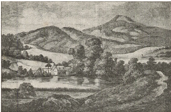
Ry Mølle efter et Billede fra 1850'erne.