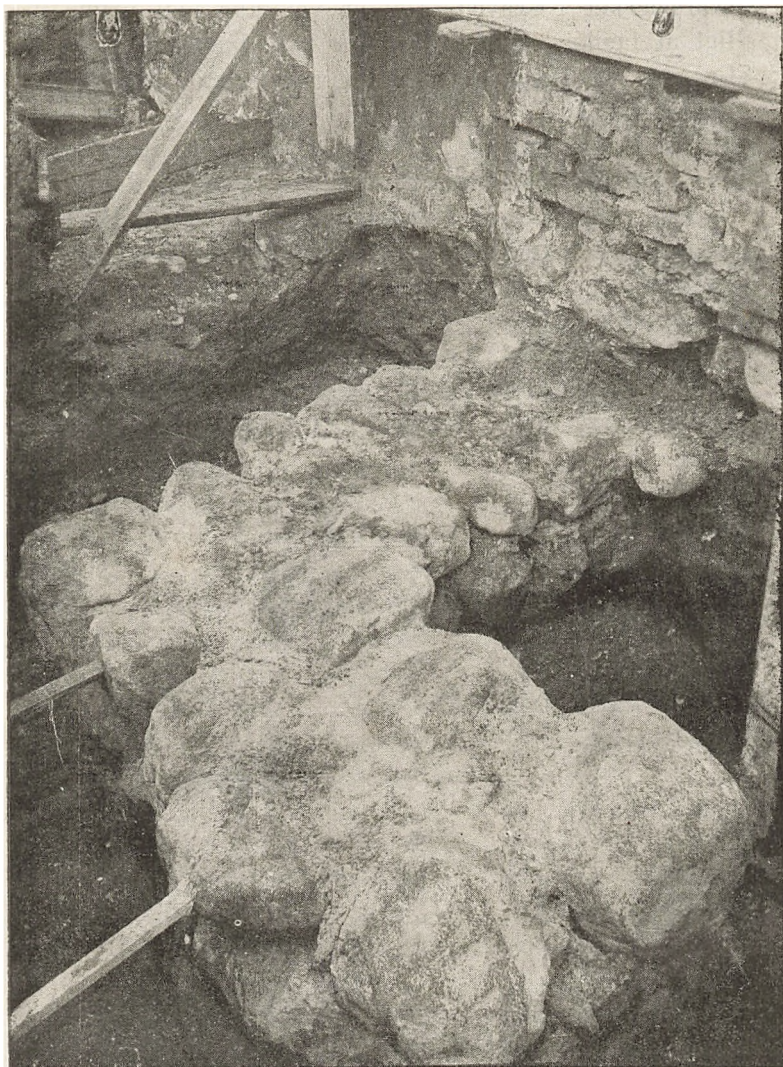
Det fremdragne, østlige Kampestensfundament.