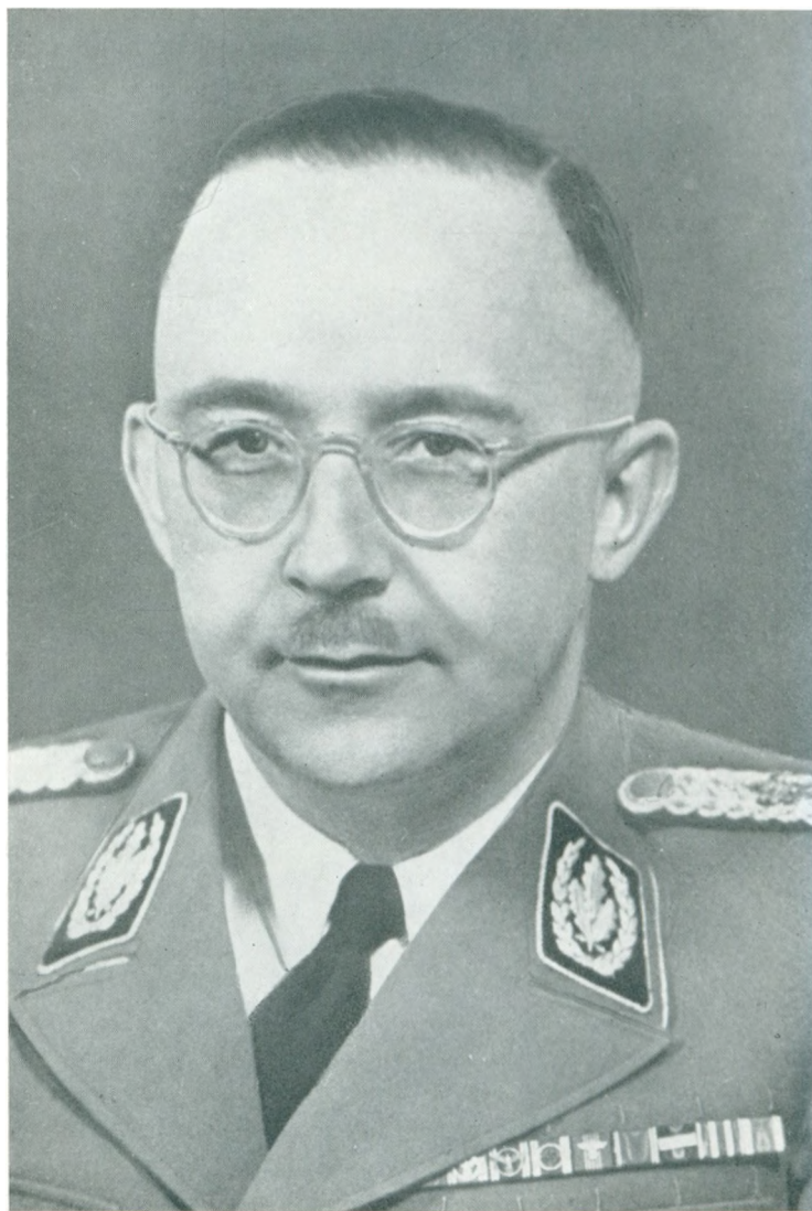
SS-Rigsfører Heinrich Himmler.