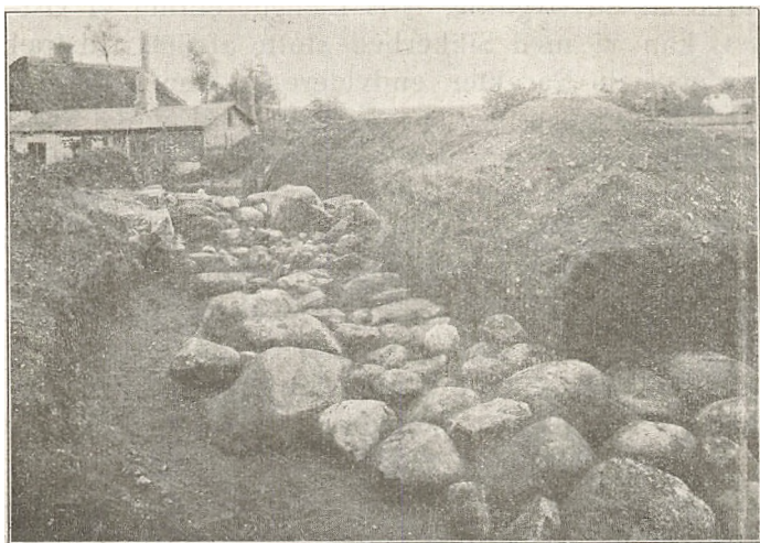
Fundamentet set fra Vest.

det lange Fundament (det paa Planen skraverede Parti) var saavidt bevaret, at det afgav Grundlag for en frugtbar Undersøgelse, og at dette Parti stod endda kun det østligste i sin fulde Højde, væsentlig bestaaende af 3 Lag store Kampesten med mindre Sten imellem til at udlige Lagene. Mellem Stenene — der alle var raa Marksten — fandtes ingen Mørtel, kun Grus og