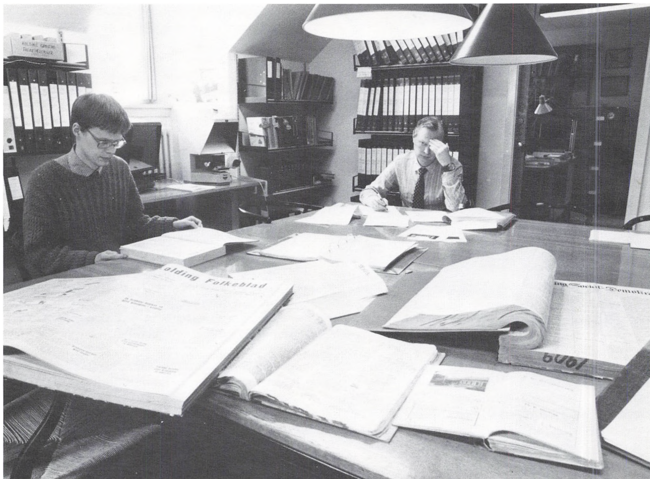
Læsesalen, Kolding Stadsarkiv