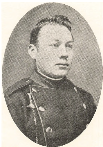
Vandman som Fæstningskonstabel paa »Trekroner« — 1876