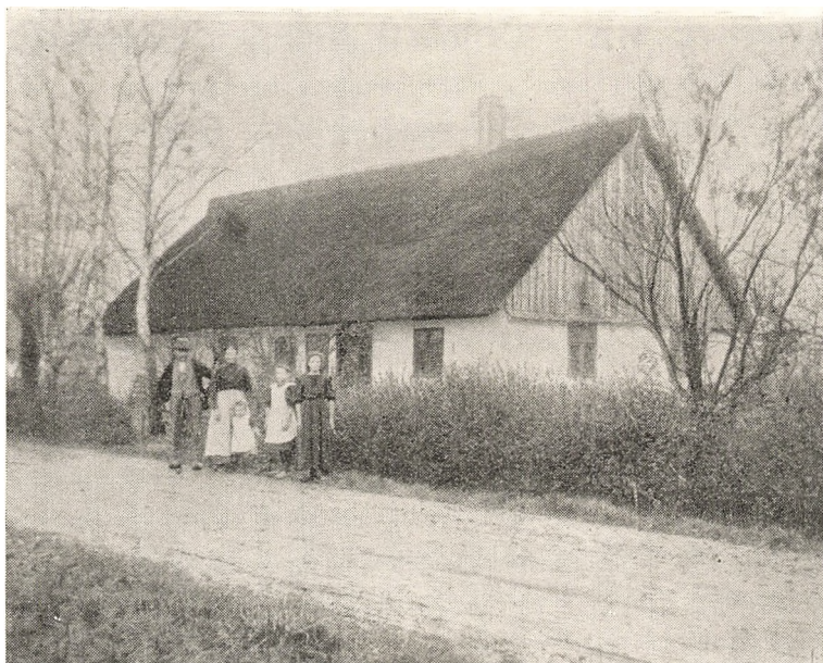
Det gamle Hjem i Skørringe