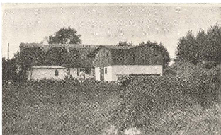
Det gamle Hjem i Skørringe med senere Tilbygninger