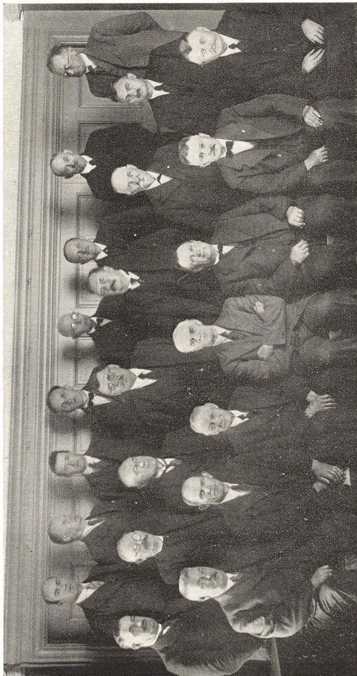
De samvirkende danske Husmandsföreningers Bestyrelse omkring 1935 (Vandman Æresmedlem)