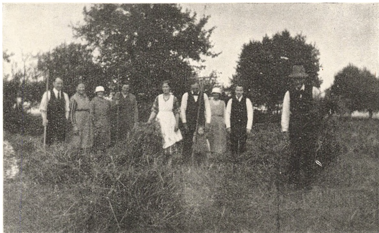
Vandman og Hustru med en Del af Familien paa Høstarbejde i Skørringe