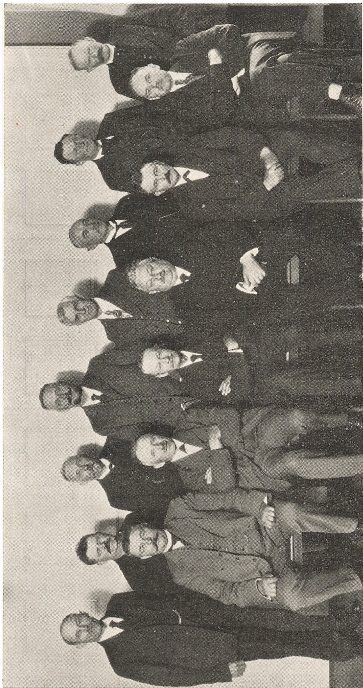
De samvirkende danske Husmandsforeningers Bestyrelse 1927