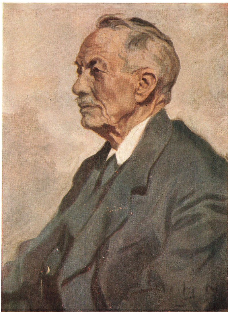
Reproduktion af Johannes Nielsens Maleri af Vandman