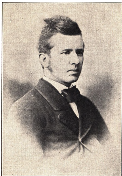
Forfatteren som Professor.

opgørelse; ved Beregningen havde jeg blandt vigtigere Indførselsvarer medtaget »Oliekager«; en højtstaaende Embedsmand haanede mig, fordi jeg i Værdiopgørelsen havde medtaget »Kager«, han troede, det var Konditorkager. Endvidere foretog jeg en betydelig Udvidelse af