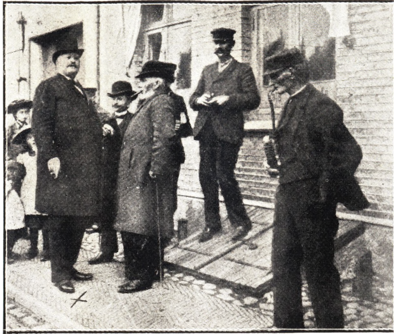
Alberti og hans Vælgere.