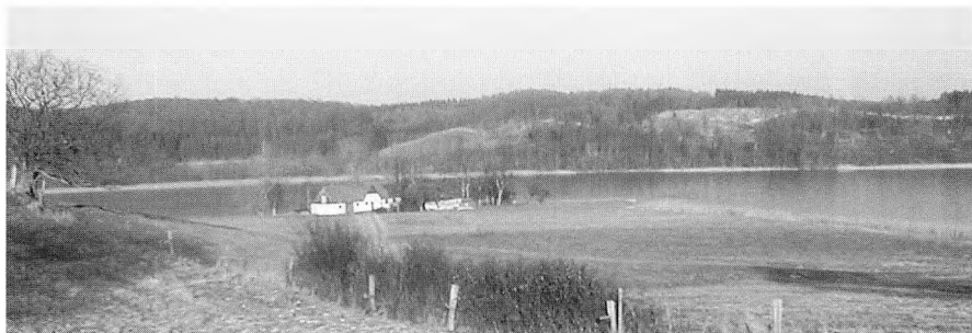
Hovgården ligger på en odde ved Tystrup Sø.

Øst for Vinstrup, i det område der kaldes for Hørhaven , ligger der på en odde ud i Tystrup sø en gård som har navnet Hovgård . Navnet på gården kan være fremkommet fra det gamle danske ord Hov som her betyder: noget man tager eller griber med , i denne forbindelse f. eks en fiskeketsjer .