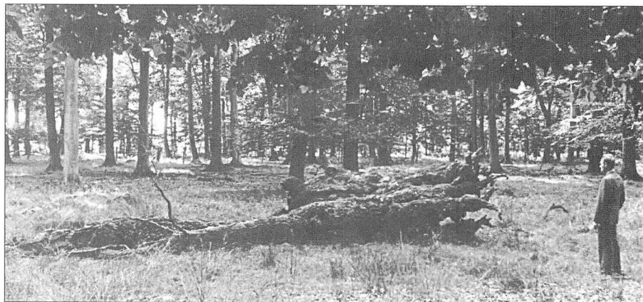
Den segnede kæmpeeg.

Ved "Borup kirke" er ikke synlige spor af dyrkelse. Men denne eg med det antydende navn var et mægtigt træ allerede i hine tider, da mange endnu troede at en særlig kraft, Mana, var bosat i naturens mærkværdigheder. Denne lynramte Starkad blandt træer har set sit. Egen er lynets foretrukne træ, og der er gotiske sprog hvor tordenguddommen har fået sit navn fra egetræets. Hvor det blændende himmelhug ramte blev det farlige og hellige siddende.