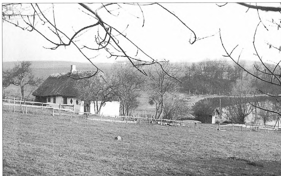
Hækkenfeldthuset før 1963.

sener, som fortidig overtro har fostret, må man se dem for sit indre blik som skygebilleder og tænke sig til deres tilstedeværelse for ikke at tabe den rette tråd og inspiration til fortidens bondetanker, der jo også var et meget væsentligt led i bondekulturen ”