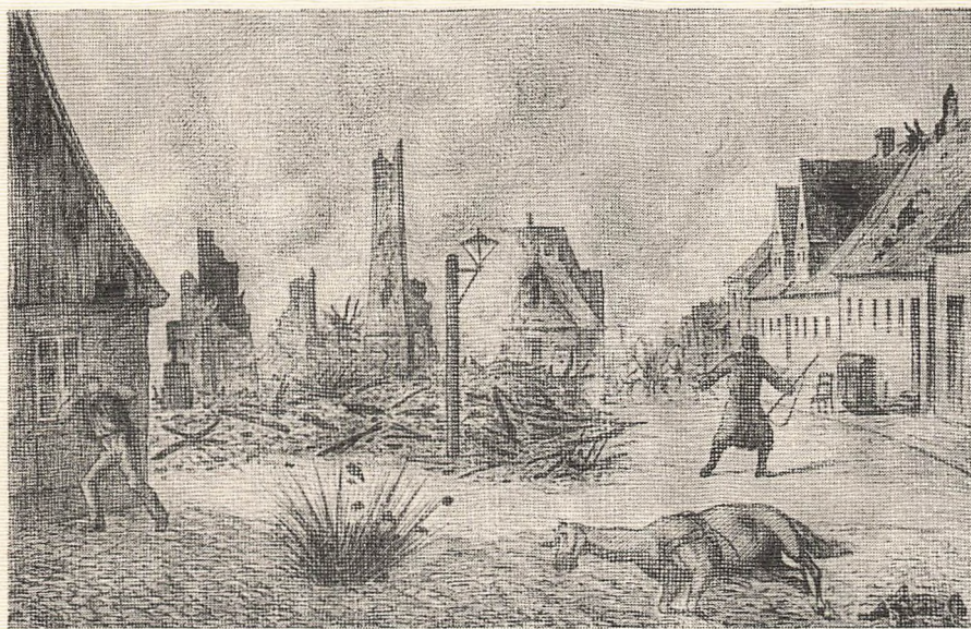
V. Rosenstand: Fredericias bombardement 1864.