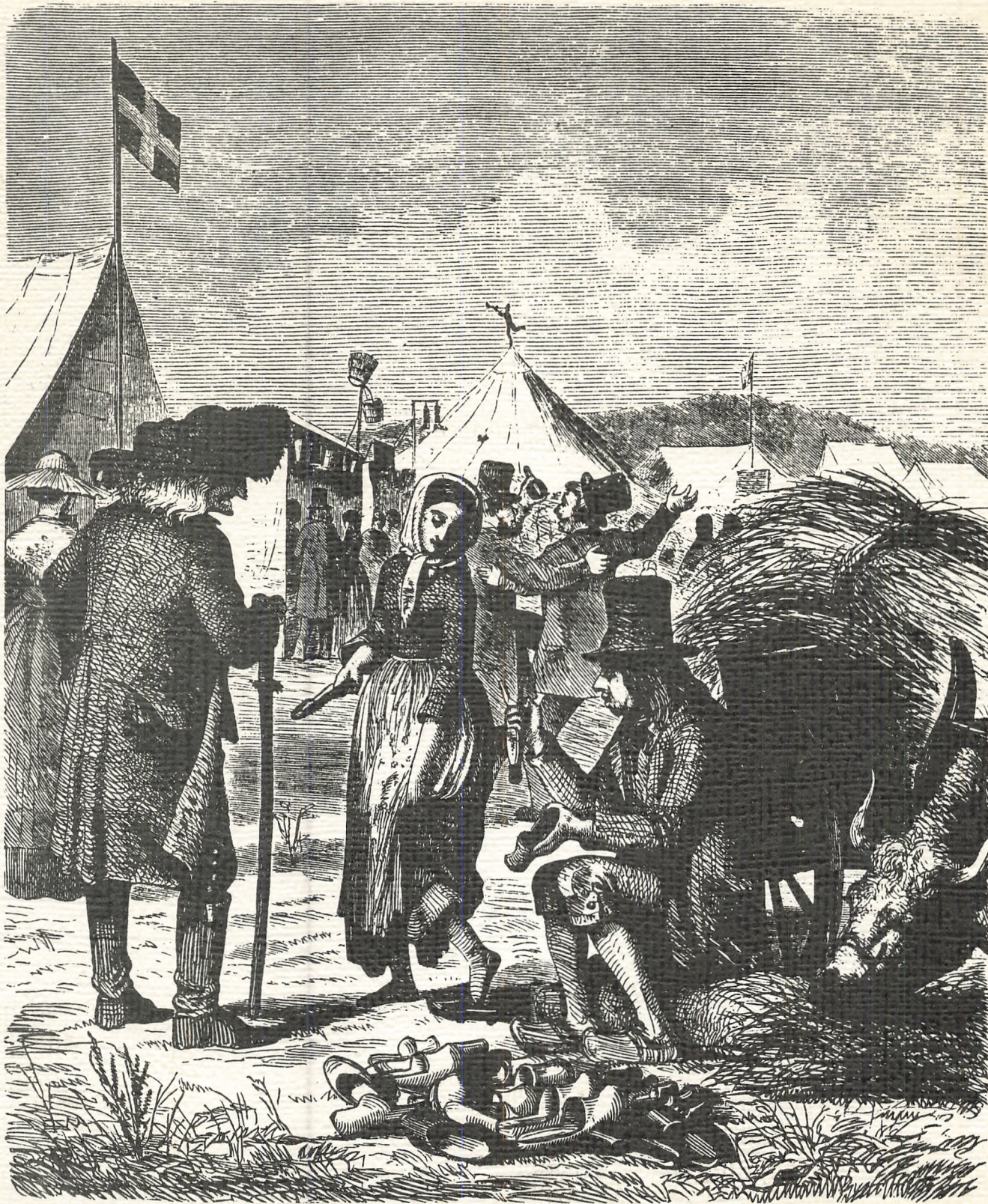
MARKEDSSCENE FRA VESTER BRØNDERSLEV 1863 Af Vilhelm Rosenstand