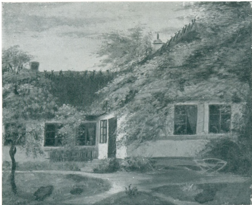
BEDSTEMODERS GAARD I ØRSLEV UNDERSKOV