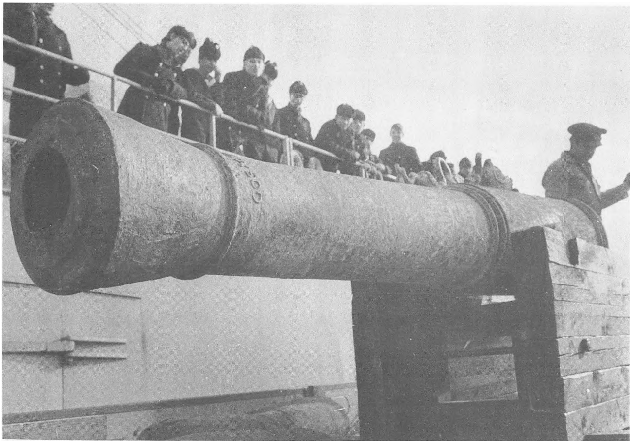
Den "lange svane" fotograferet ved ankomsten til København. Lavetten er udført af danske orlogsgaster under nedtransporten til København.