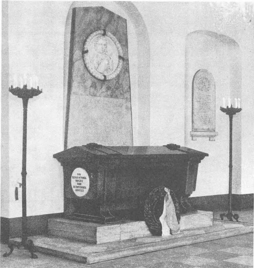
Tordenskiolds sarkofag som vi kender den i dag