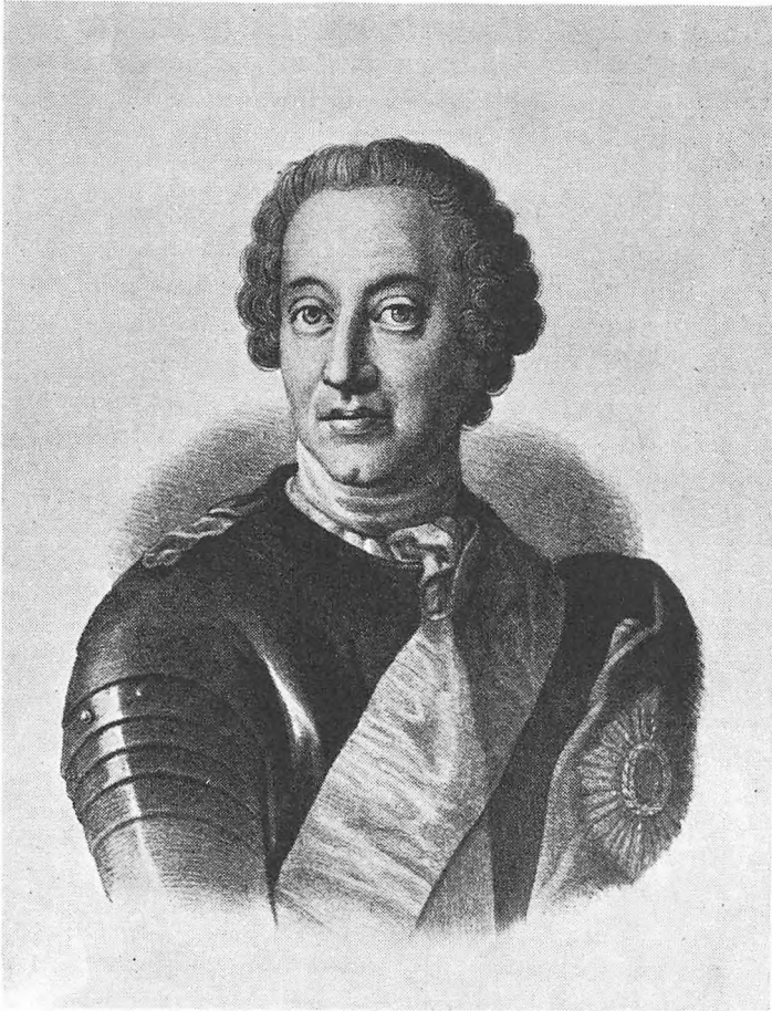
Flådens fremragende administrator 1735-46 og 1766-67 grev F. Danneskiold-Samsøe.

Forholdene tegnede sig således ret lyse for Søetatens vedkommende efter den store nordiske krigs ophør. Overledelsen fik en fastere karakter ved, at Gabel i 1721 blev udnævnt til præses for Søetatens Generalkommissariat og til "directeur" for Flåden og Holmen (2). Hele krigsvæsenet og i ganske særlig grad Søværnets tråde samledes nu hos én og samme mand. Gabel faldt dog i 1725 i unåde "ved sine politiske anskuelser og især i de slesvig-holsten-