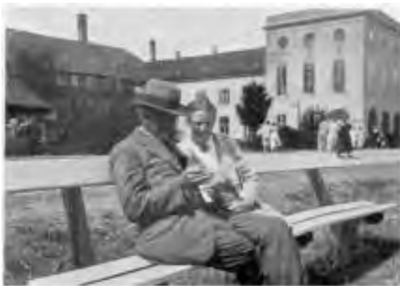
Forstanderparret har faaet Brev (Nyborg Strand).