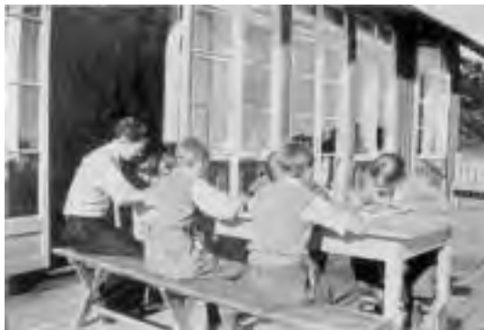
Der skrives Rapporter.

Eventyret fremstiller det? Var den lykkeligste Mand i Verden; ikke ham, der ikke engang ejede Skjorte paa Kroppen? Og hvad er vel mest værd, hvis man nu skulde vælge: Et langt Liv indpakket i Vat og Bomuld og alle mulige Slags i Forsikringer, et Læhus, hvor Stormens Livtag aldrig formaade at trænge ind, eller et kort Liv levet med bankende Puls? (Jeg kan ikke