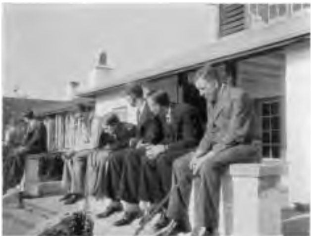
Herr Hager mediterer.

Gud ene Tiden deler, han saarer og han heler han kender smaat og stort; han intet ondt bestemte og intet godt forglemte, alt, hvad han gør, er herligt gjort.