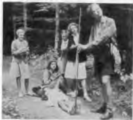
Hvor højt er Træet?

En af „de gamle" sagde til mig ved Nytaarsfesten den 2. Januar i Aar: „... det var vel nok dejligt, jeg tænker paa Gjorslev, ih, hvor havde vi det rart der".