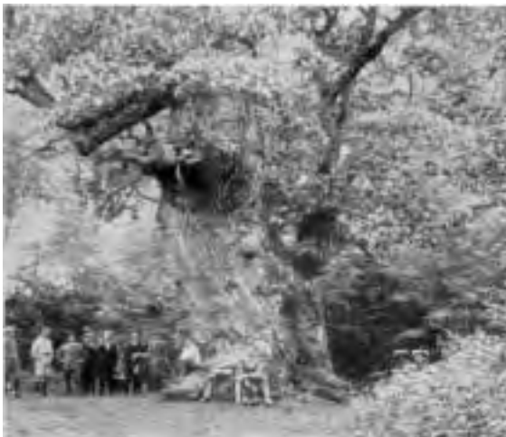
„Danmark i tusind Aar“.

I vor bombehærgede Tid skulde man synes rigtig at kunne sætte sig ind i Dyrenes Levevilkkaar: at leve fra Haanden i Munden og ikke i Dag at vide, hvor Føden skal komme fra i Morgen. Og dog — hvordan er det