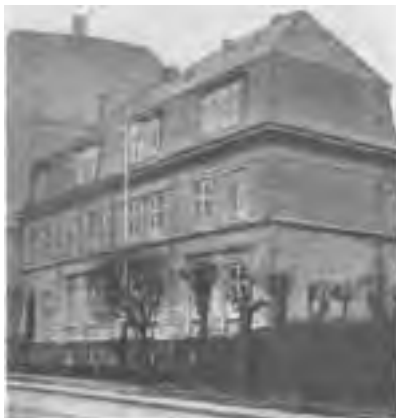
Chr. Winthersvej 3.