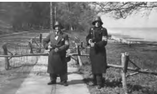
Det har utvivlsomt været dette sted på Nordre Strandvej i Julebæk, at tyskerne har stået vagt. Her er det dog danske frihedskæmpere, der har overtaget kommandoen på stedet i maj 1945.

hunden, tyskerne kaldte på, men lidt efter så jeg ham med cyklen nærme sig bagfra for fuld fart. Jeg stoppede helt op med det ene ben på jorden, idet han kom udenom. Han svingede brat ind foran mig, men væltede på hovedet ind i rabatten, hvor han lå og vandede sig. Jeg lagde cyklen og gik hen for at hjælpe ham op. Da han så mig komme, blev der liv i ham. Det var en lille, kraftig sergent, og han sprang op som en gummibold og plantede et perfekt højre sving på min kæbe. Nu var det mig, der lå i rabatten, og da jeg kom op igen, havde de to fodsoldater og hunden indfundet sig i hurtigløb. Sergenten kæftede op med, at jeg burde være skudt på stedet, fordi jeg ikke var standset, da han råbte »stop«. Jeg var rasende, og da jeg desuden var overbevist om, at mine falske papirer var i fineste orden, tog jeg offensiven på tysk. Jeg brølede ind i hovedet på ham, at det var en dårlig soldat, der ikke engang kendte sit tjenestereglement. Fra min fangetid vidste jeg nemlig, at tyskerne kun havde to reglementerede råb, hvis nogen skulle standses, nemlig det tyske »halt« og det tilsvarende danske »holdt«. »Stop« var helt ureglementeret, og det fortalte jeg sergenten og tilføjede af mine lungers fulde kraft, at hvis han ikke holdt sin kæft, så skulle jeg straks i morgen tidlig få ham sat i spjældet for vold mod en sagesløs dansker. Det gjorde indtryk. Han blev meget afdæmpet og erkendte sin fejl. Der udviklede sig nu en mere afdæmpet diskussion, der snart gik