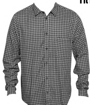
Skjorte: Cheap Monday, 399,-