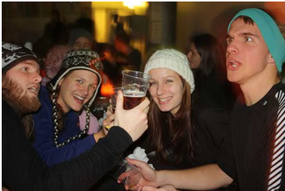
VARME HUER OG KOLDE ØL SÆTTER STEMNINGEN PÅ NYELANDSVEJ

Der går rygter om at fredagsbaren på netop vores seminarium er den bedste. Faktisk er den så god, at flere fyre fra CBS, og også fra andre uddannelsesinstitutioner, vælger at deltage i vores fredagsbar. Det kan måske