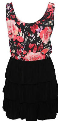
Kjole: Motel, 449,-