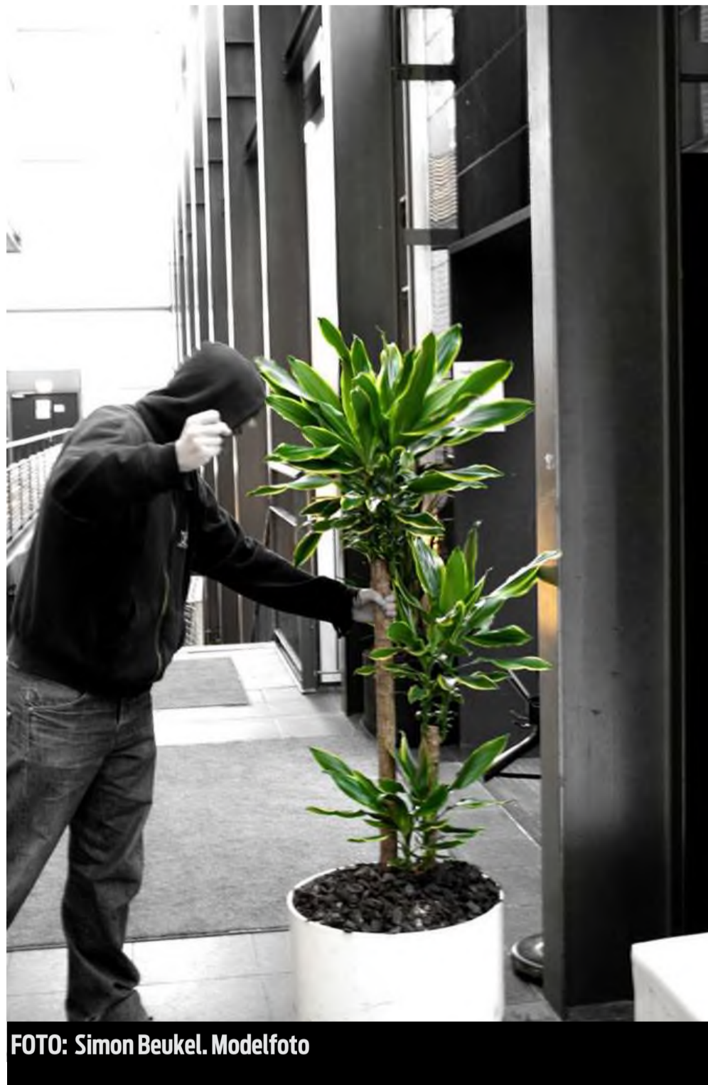
Modelfoto