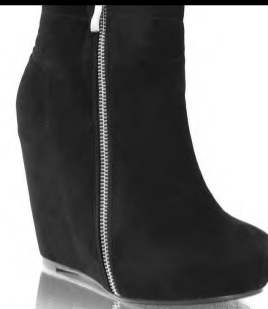
Wedges: Nelly Shoes, 349,-