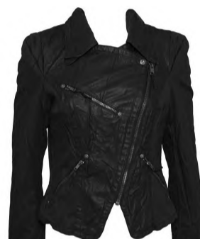
Jakke: Only, 399,-