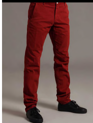
Bukser: Elvine, 699,-

Nytåret nærmer sig! Festen skal begynde, champagnepropperne skal springe, og fyrværkeriet skal farve himlen i millioner af farver. Dette er aftenen, hvor man skal se lækker-smækker ud! Skjorten skal stryges, skoene skal pudses, håret skal sættes, og make-uppen skal lægges.