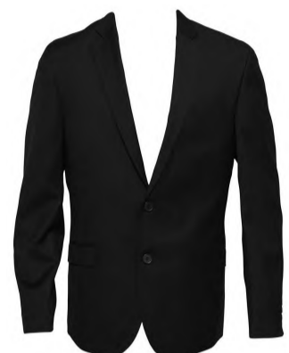
Blazer: Selected Homme, 599,-