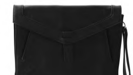
Clutch: Jean Blush, 99,-