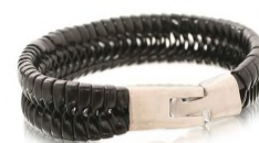
Armbånd: Nelly Accessories, 39,-