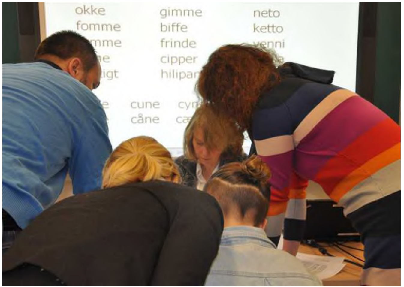
Undervisning i dansk indskoling