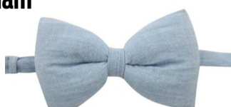
Butterfly: Red Collar Project, 159,-