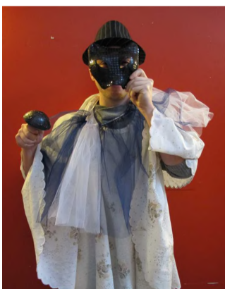
På rov i glemmekassen