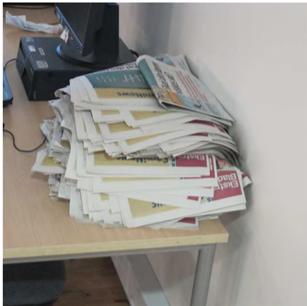
Ulæste aviser i bunkevis.

Ifølge studieordningen er det obligatorisk at være med, men der bliver ikke ført fravær. Det resulterer i, at der opleves, at det kun er dele af holdene, der står for projektet. Dernæst er tidspunktet af avisprojektet ikke medberegnet. De hold der skriver avis som nogle af de første, vil have mere tid, end de hold, der skriver fra start juleferie til lige før praktik. Der ligger masser af muligheder i projektet, som fx kunne bruges i praktik. Da avisen bliver skrevet i månedsperioder, vil det hold, der starter på en ny avis ikke have indblik i indholdet i den forrige