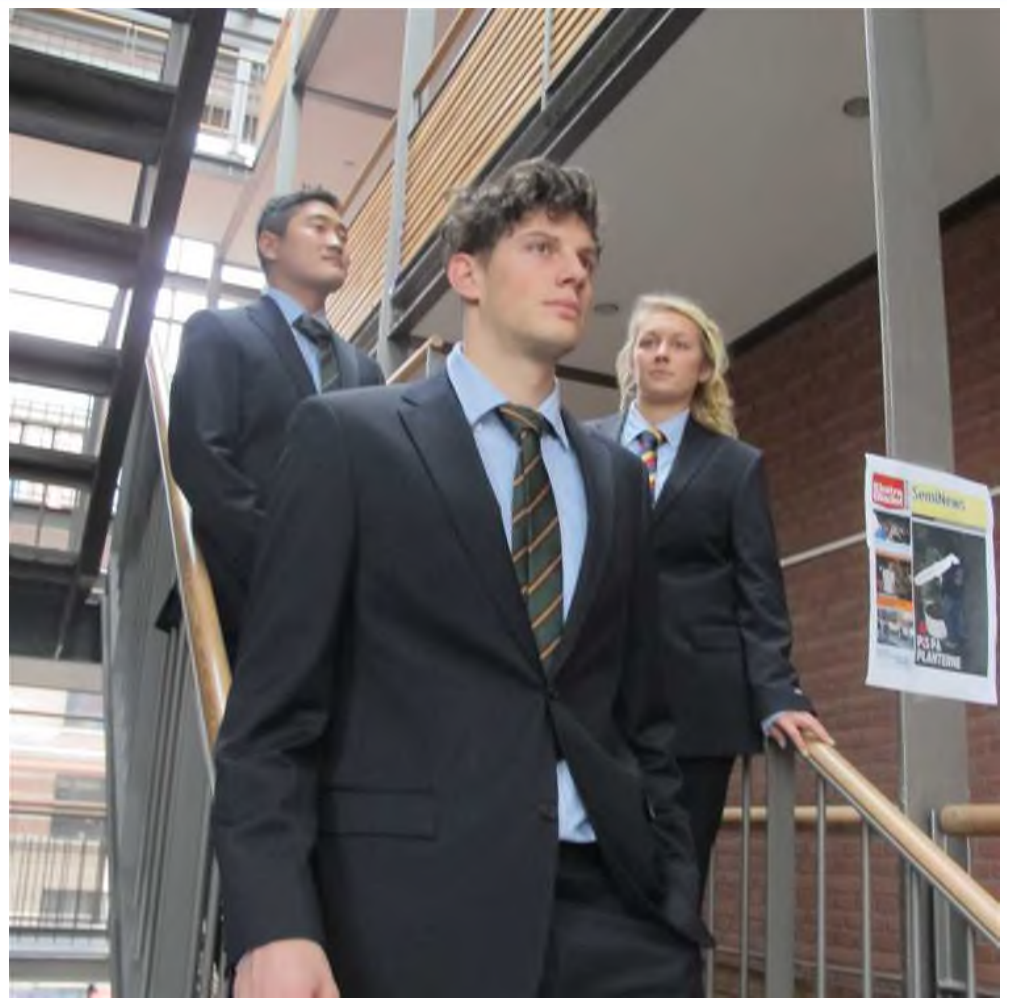
FOTO: Simon Skov Fougt. Jakkesæt venligst udlånt af Ginsborg, Frederiksberg Centeret.

"Pæn påklædning signalerer ro, parathed og overblik. Det viser at de studerende har styr på deres ting. Udfordrende tøj signalerer typisk sex og andre rebelske tanker. Derfor påvirker det tit de studerendes koncentration. Dybe nedskæringer, stramme T-shirts og bare ben, dette skal udryddes med skoleuniformer. Nogle vil mene, at det fratager deres