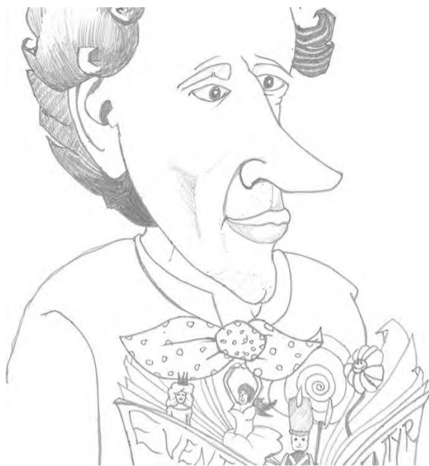
Illu: Jonas Budtz Møller

Du kan også møde op som tilhører, og få en god og afslappet aften, -vi kan jo alle lide at få læst et godt eventyr højt.