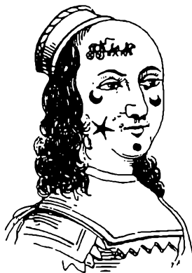
Kvinde med ar efter kopper

At blive koparret var selvsagt enhver kvindes skræk. Men var man snarrådig fandt man på at klistre en lille stofklat af form som en