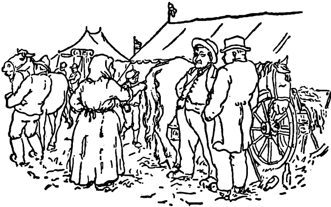
Hwis er æ sölle hæj'st?

hun mistænksomt pegte på en af mændene. Han svarede nej, og det gjorde de alle, eftersom hun sigtede snart den ene, snart den anden, ingen ville kendes ved dyret. Da udbød hun harmfuldt: I æ føldt mæ löw'n o skit åld'sam'!