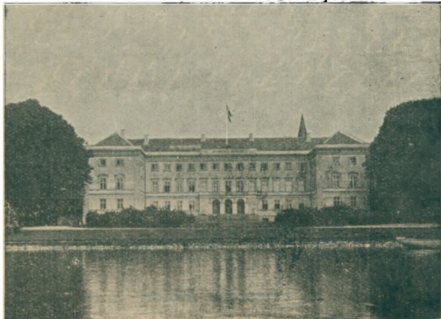
Sorø Akademi set fra Søen.

Udgaaet fra Landsarkivet for Sjællands Bibliotek