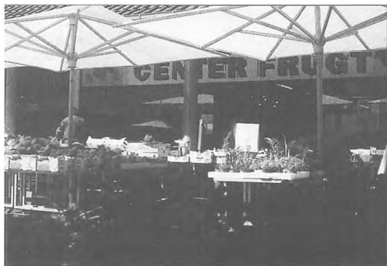
Grønhandleren i Espergærde Centret er ifølge flere besvarelser »Danmarks bedste grønhandel«. Carsten Møller fot. 1996.

Der er praktisk talt ikke en husstand i undersøgelsen, der ikke køber i det mindste nogle af deres dagligvarer i Espergærde og her fortrinsvis i Espergærde Centret. Espergærde Centret lever tilful-