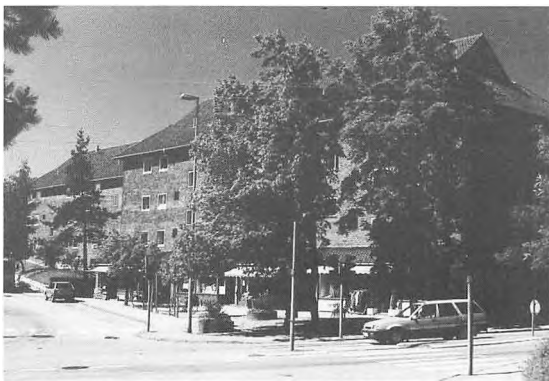
Skovparken på hjørnet af Mørdrupvej og Kløvermarken, opført i 1951, var en af de første etagebebyggelser i Espergærde. Carsten Møller fot. 1996.

I bebyggelsen tog nogle beboere initiativ til at lære hinanden at kende, og der blev holdt beboeraftener på Skotterup Kro, hvor der var musik og dans. Det var vældigt hyggeligt syntes det unge par, men det ebbede efterhånden ud. Men det gjorde ikke så meget, for på det tidspunkt havde de allerede lært mange at kende.