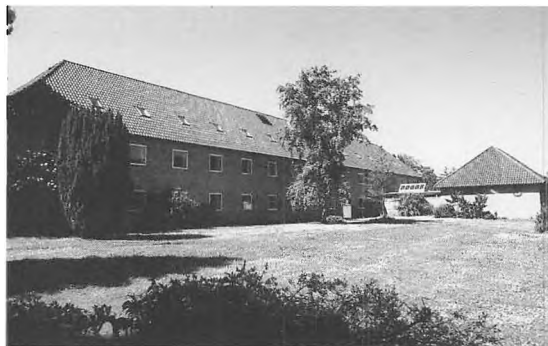
Administrationsbygningen på Mørdrupvej, hvorfra Tikøb Kommune en kort overgang blev styret. I dag bruges bygningen af Helsingør Kommunes Tekniske Forvaltning. Carsten Møller fot. 1996.

Med udgangspunkt i Helsingør bys meget lille areal og opfattelsen af, at Tikøbområdet i første række fungerede som forstad for Helsingør, foreslog Kommunallovrevisionen, at Helsingør og Tikøb Kommune skulle slås sammen.