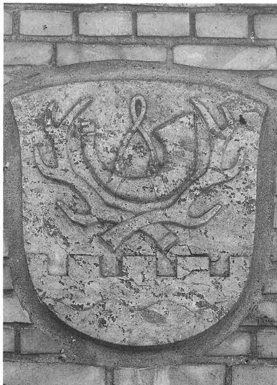
Den gamle Tikøb Kommunes våben sidder stadig på muren på den gamle administrationsbygning. Carsten Møller fot. 1996.

Medens debatten og agitationen stod på, arbejdede politikere og embedsmænd i de to kommuner på at