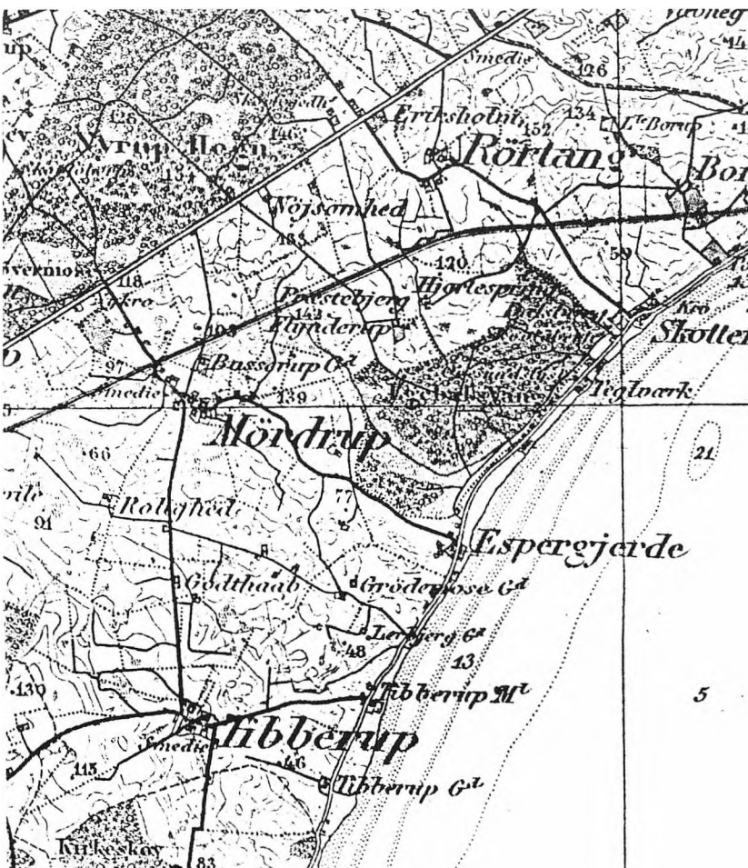
Udsnit af kort fra omkring 1870, hvor landsbyerne Tibberup og Mørdrup samt fiskerlejet Espergærde endnu ligger langt fra hinanden. Kystbanen er endnu ikke anlagt; de rejsende må ty til den gamle Nordbane.

Idag spreder Espergærde sig fra kysten og godt 2