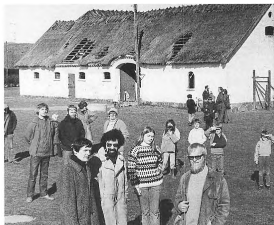
Egegaarden som den så ud før istandsættelse til beboerhus. Kampen for Egegaarden blev i 1970 samlingspunkt for en del af Espergærdes borgere.

På gården var en forfalden lade, der ikke blev brugt til noget. Espergærde Amatør Scene mente, at den ville egne sig fint som øve- og forestillingssted, og de spurgte kommunen, om de kunne låne laden, sætte den istand og bruge den sammen med andre grupper og foreninger f.eks. folkedanserne, der ligeledes manglede lokaler. Man ville selv bekoste