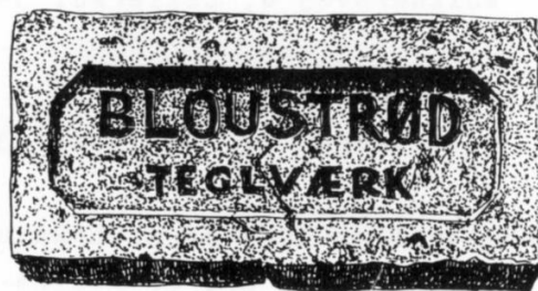
ÆLDRE MASKIN PRESSET MURSEN FRA BLOVSTRØD TEGLVÆRK

Frederiksholms Teglværker er nu rykket helt ud af det gamle Blovstrød Teglværk, og efter udflytningen modtog vi et meget stort (200x150cm) oliemaleri af Blovstrød Teglværk fra ca. 1876.