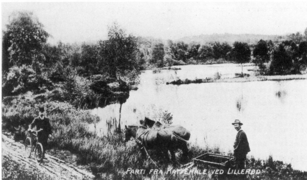
Tørve"gravning" ved Allerød sø. Når tørvemassen ikke kunne skæres ud af brinken, blev det tørveholdige dynd øst op af vandet og siden tørret.

ne læses ud af engarealet og engenes beskaffenhed.