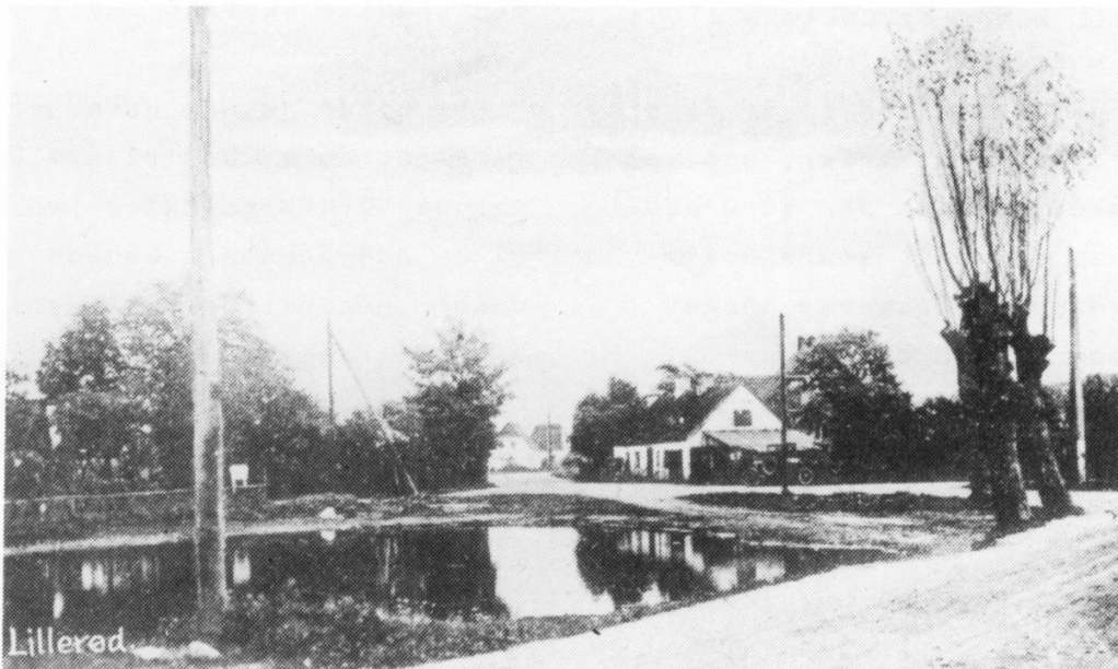
Lillerød gadekær fotograferet omkring 1924, tæt på det tidspunkt, da Kurt Carlsen trådte sine maritime børnesko i Lillerød.

lien en overgang her i byen. Det kan dog ikke have været mange år, da faderen i 1923 var chauffør på den første rutebil mellem Gurre og Helsingør.