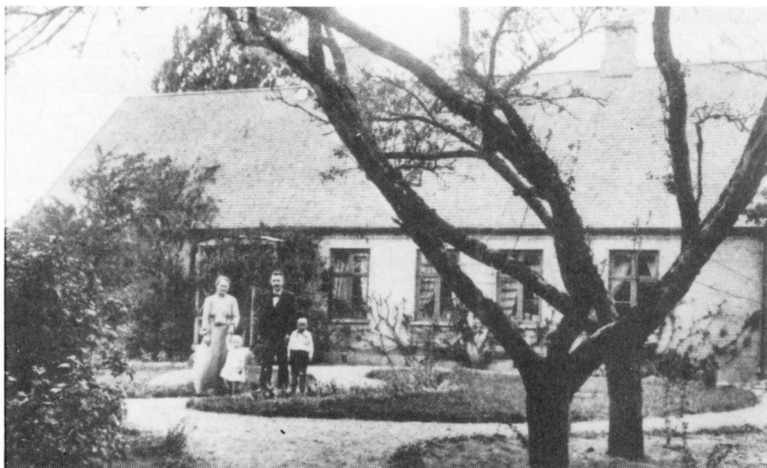
Haven og skolen omkring 1920 med lærerfamilien

sioneret og flyttede over på sin samtidig blev sognerådet anmodning om at udsætte nedbrydningen, til det forelå svar fra ministeriet. Sognerådet efterkom ikke anmodningen, og udhuset blev nedbrudt og materialerne anbragt på skolens brakmark. Den 21. juli 1873 henviste ministeriet sagen til domstolenes afgørelse. Sognerådet anlagde kontragsag mod Andersen, idet det ønskede sig tilkendt 20 Rd. l. r. med renter for udgifter i forbindelse med nedbrydningen af udhuset samt Andersen dømt til at fjerne husresterne fra skole- sioneret og flyttede over på sin ejendom på Lyngevej 218. Herfra fortsatte han kampen for sit udhus, men i 1873 besluttede sognerådet at bygge et nyt udhus ved Vassingerød skole. Den 12. maj 1873 fik Lars Andersen tilhold om at borttage sit udhus ved Vassingerød skole inden 1. juni, da det ellers ville blive nedbrudt for hans regning. Andersen mente ikke, at han kunne skaffe penge, folk, heste og vogn til at flytte med i den usømmelige korte frist fra 12. maj til 1. juni. Han ankede sagen til Kultusministeriet, og