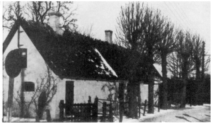
Billede nr.2: Tokkekøbvej nr.1 ?