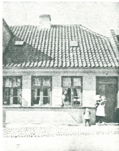
Barndomshjemmet i Dalegade (nu nedrevet)