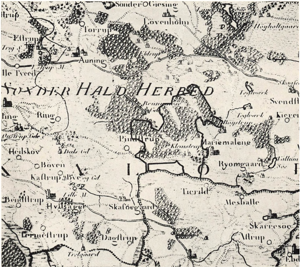
Udsnit af Videnskabernes Selskabs Kort fra 1789 over Dronningborg og Kalø Amter. Maalestoksforhold 1 : 120.000.

Ejendommens Grænser skønmæssigt indlagt med sort Linie.