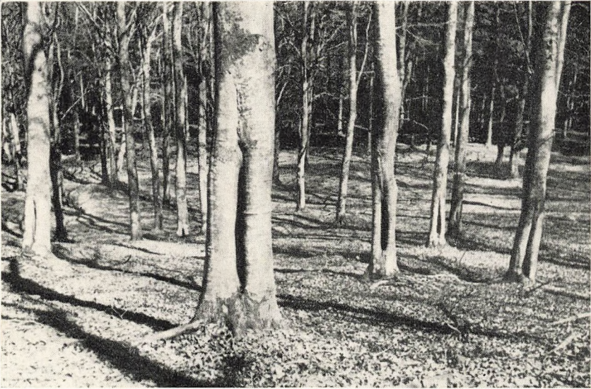
Brandsaar paa Bøg (fot. 1942).

Skovpart III Afd. 24. Bevoxnings Alder c: 130 Aar; fra hvilket Aar Brandskaden stammer, vides ikke.