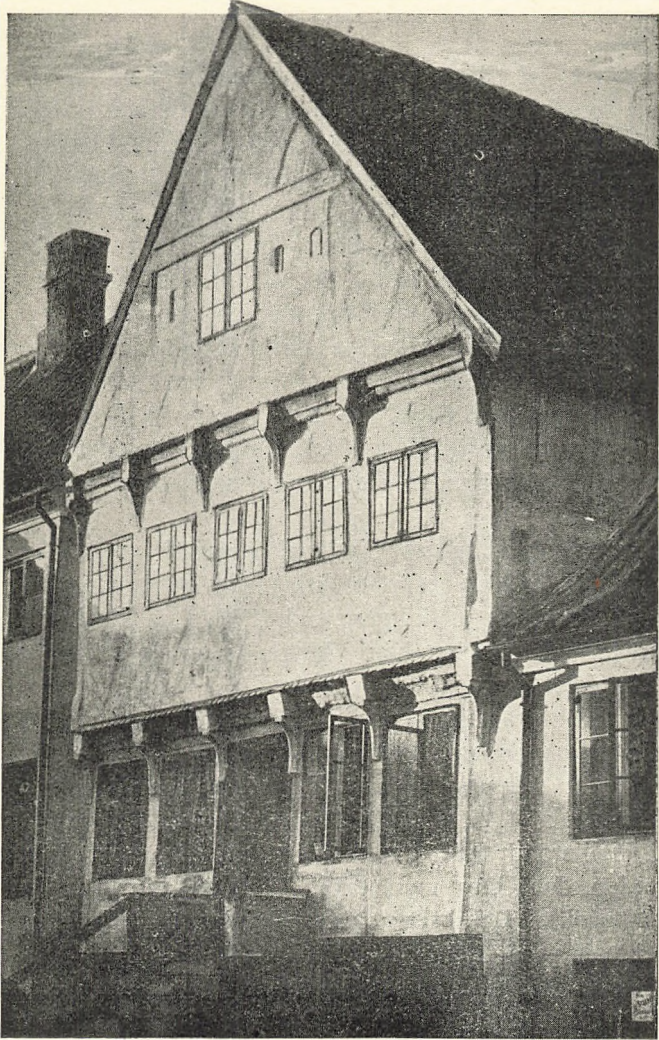
Gavlluset som det saa ud 1910.