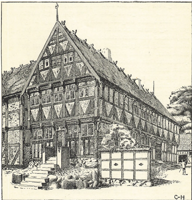
Husets Udseende omkring 1650.

Tommer til 10\frac{1}{2} \times 8 Tom., Spærene 9 \times 7 Tom., Knægtene 18 \times 16 \times 5 Tom. Loftsbrædderne 11 \times 1\frac{1}{4} Tom. Løsholterne har 7 Tom.s Façadebredde.