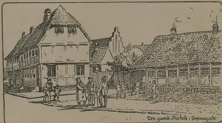
Den gamle Friskole i Gørbælgade

ALBERT BAYERS FORLAG AARHUS OG KØBENHAVN