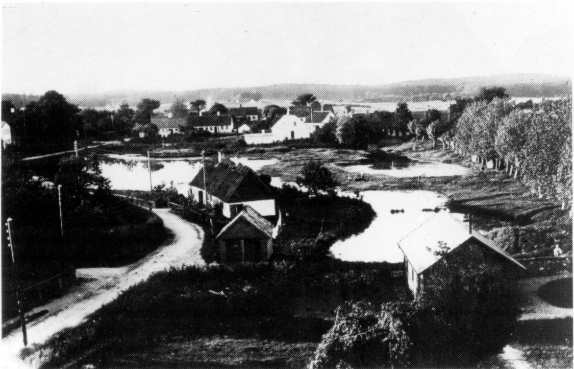
Blovstrøds "Grønholm" set fra kirketårnet i 1916.

Tilmelding til Arkivet senest den 24.april på tlf 42 27 08 91.