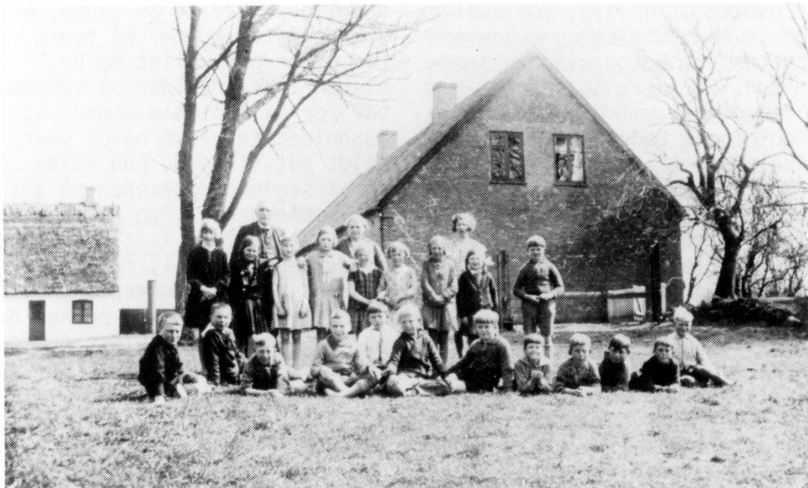
Vassingerød (gamle)skole på Gl.Vassingerødvej. Billedet er fra 1931 og børn og lærer har derfor ikke noget med vores hovedperson at gøre. Skolen ligger der endnu idag.