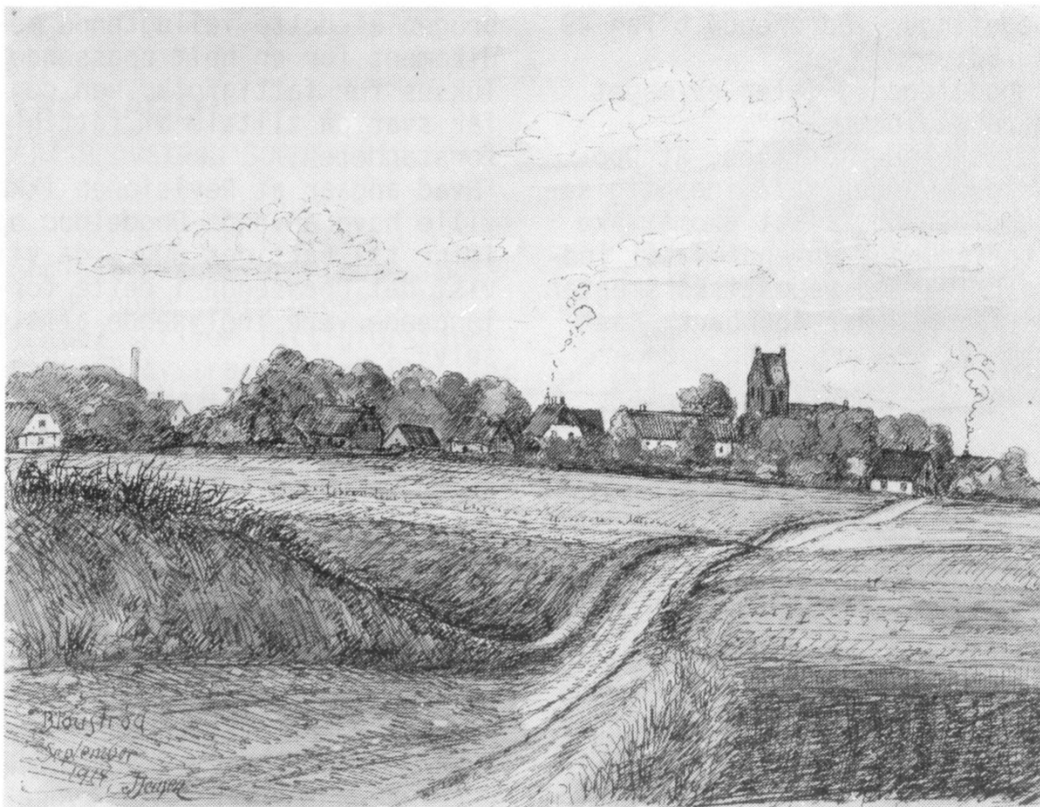
Farvelagt tuschtegning ,sign.J.Jensen : Bloustrød,september 1914. Man ser landsbyen fra en markvej vest for Kongevejen; i midten med skorstensrøg ses præstegården,yderst th (med røg):Kildebakkegård og til venstre anes møllens vinger og bageriets skorsten.

Lokalhistorisk Arkiv på Frederiksborgvej 59,Lillerød har åbent hver TIRSDAG kl. 9-13. Der er åbent hus hver første ONSDAG i måneden fra oktober-maj, samt efter aftale med arkivleder Birthe Skovholm formiddage man-tors på arkivets tlf : 42 27 08 91