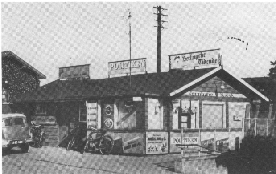
Stationskiosken lå i 1958 samme sted som den nuværende. Bemærk nedgangen og til venstre et 2-etages beboelseshus for jernbaneansatte.