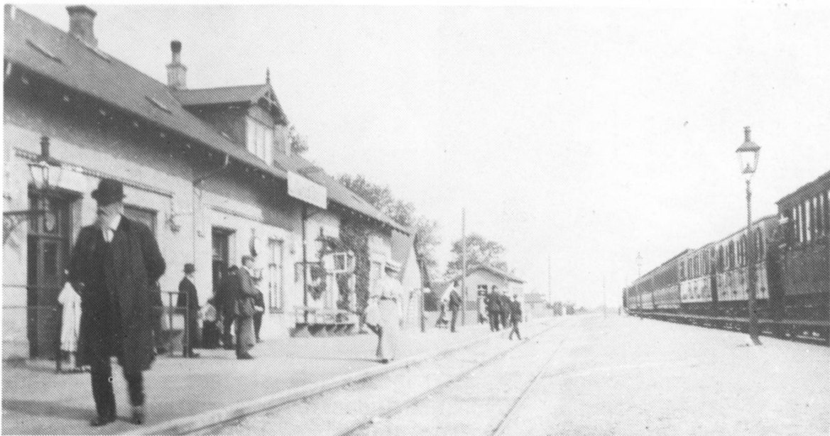
Lillerød station ca. 1909: Sporene ses helt tæt på stationsbygningen, og der er ingen perroner. Fotografiet kendes af mange, fordi det hang som fotostat i Sparekassen på M.D.Madsensvej.