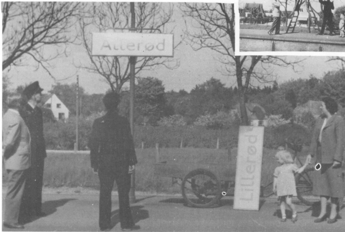
Sådan! 13.5.1952 udskiftedes stationens navneskilte, og fotografen har dækket situationen i et par optagelser, hvoraf dette er helt nyt for arkivet.