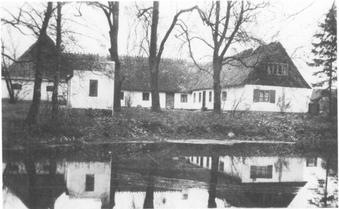
Sandholmgård på Sandholmvej i Horsemosen. Eksisterer endnu i samme stil som her (ca. 1950). Søen er nu fyldt op, høsehuset nedrevet og i stedet er der bygget gule parcelhuse. Sandholmgård var sammen med Horsemosegård de eneste landbrugsejendomme i Horsemoseområdet.