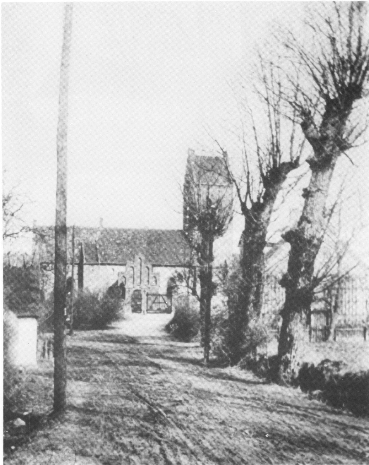
Lillerød kirke og Frederiksborgvej i 1920'erne. Frederiksborgvej var bygaden og ses her som opkørt jordvej, længe inden man begyndte at tjære vejene. Poplerne til højre står foran Kirkehavegård, hvis oprindelige indkørsel var den nærmest kirken. Til venstre gavlen af et gammelt stråtækt hus, der siden er erstattet af det nuværende, nydelige hvide teglhængte hus. Desværre findes ingen fotos af det første hus i arkivet. Endnu?