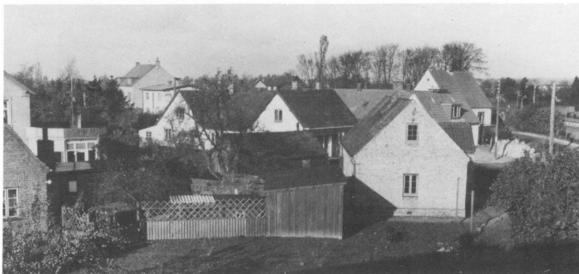
"Øen" ved Stationspladsen fotograferet af Gunnar Larsen i 1958 fra et vindue i ejendommen M.D.Madsensvej 1. Huset på "Øen" til højre, nærmest stationen, er et almindeligt banehus. Det andet, en rødstensvilla, var også beboet af banepersonale. Bagved ses ejendommen Paradisgården til højre og pendanten overfor med Rønne Allé imellem. Til venstre: "Villa Vito".