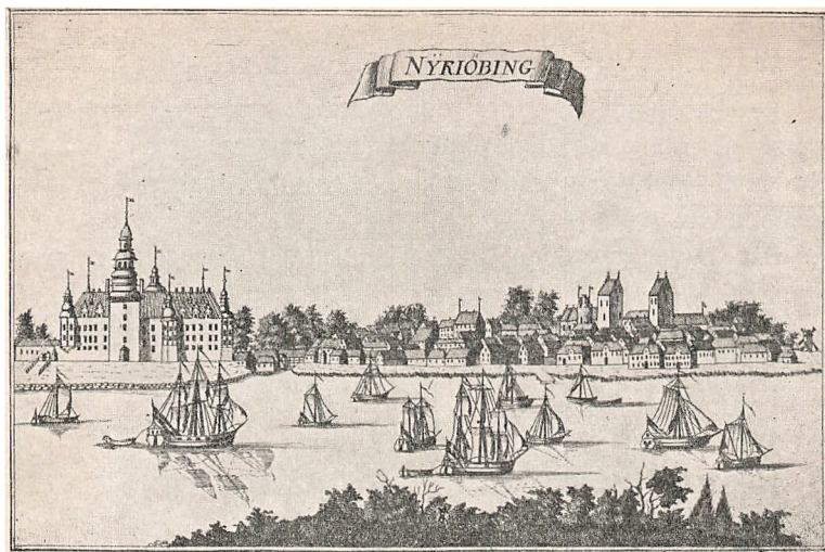
NYKØBING efter „Danske Atlas“ 1767.