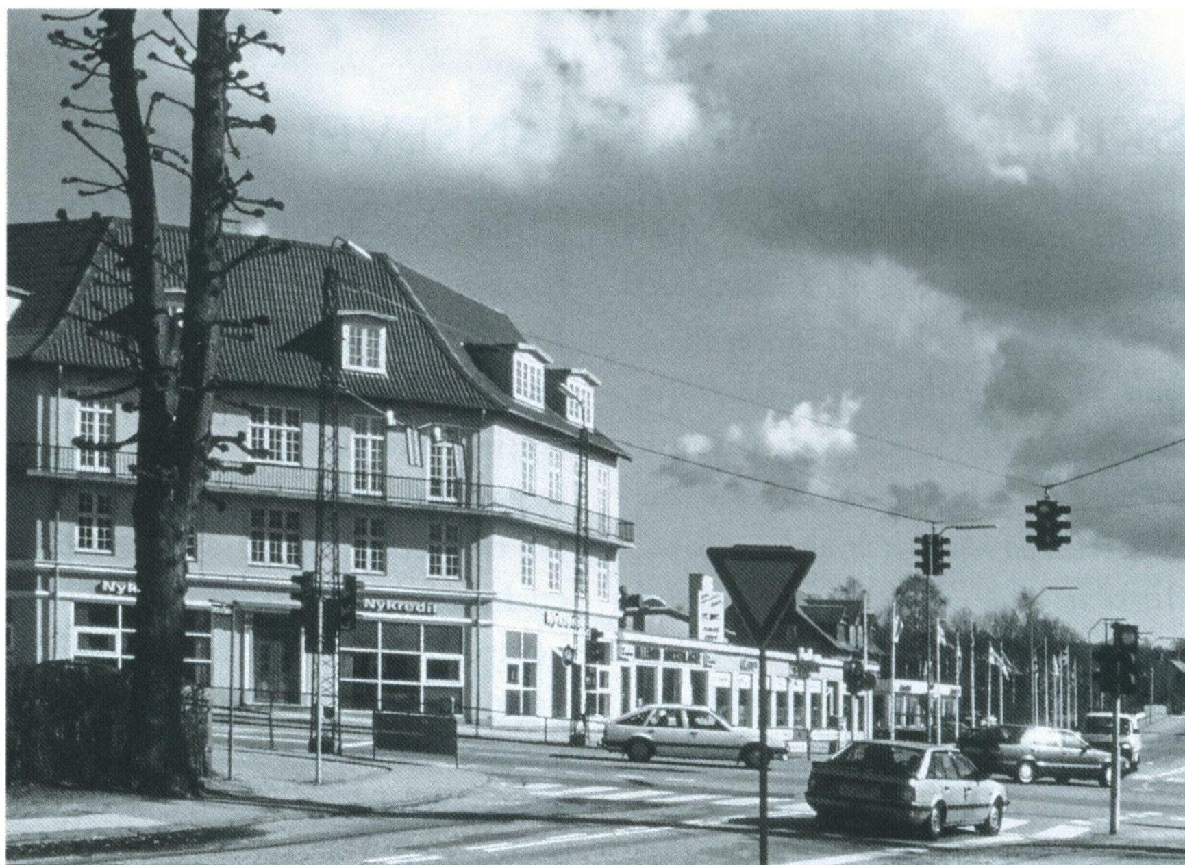
Tikanten, marts 1994.

Så kommer man op til Tikanten. Egentlig burde den hedde Bergs plads efter statuen i hjørnet ned mod Jægerbakken. Nu virker den gamle bladejer lidt malplaceret. Tikanten hedder den ifølge min far efter den tikantede bygning, hvor der nu er ejendomsmægler. Men vi