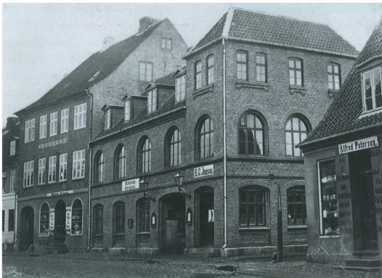
Slotsgade 7-9, ca. 1880.