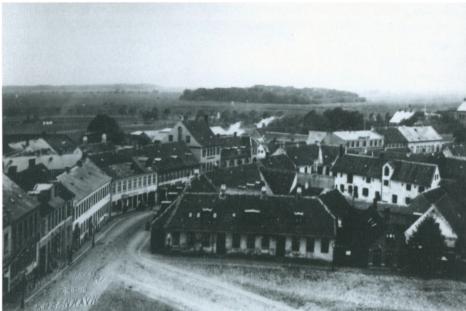
Torvet ca. 1890.