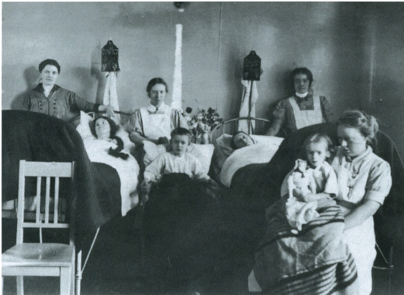
Sygestue på Frederiksborg Amts Sygehus, ca. 1910-15.

overholdt. Jeg mindes en sygeplejerske, der først åbnede døren, når klokken faldt i slag, og der blev også meldt besøgstid forbi, når timen var gået.