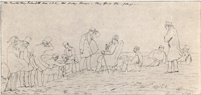
Hs. Majestæt Kong Frederik VII lader den 9. August 1861 foretage Boringer i Kong Gorms Høj i Jellinge.