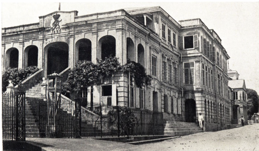
Gouvernementshuset i Christiansted, færdigbygget af Scholten 1836. Trappen vender mod Øst. I Baggrunden skimtes Korset paa den danske Kirke.