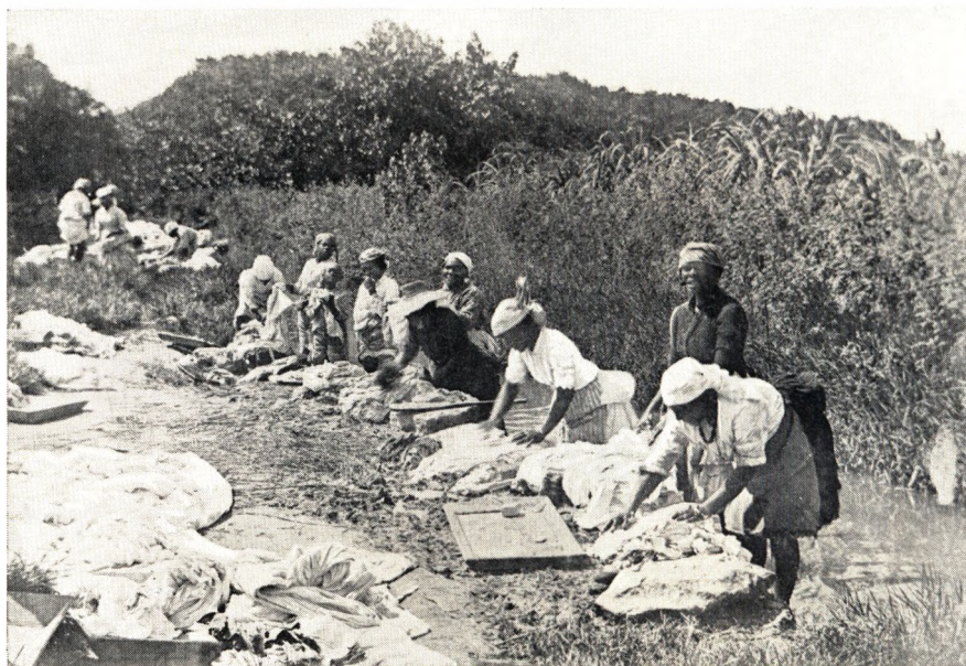
Negerkvinder i Færd med at vaske Tøj i en „Gut“, et lille Vandløb. Negrene er meget renlige af Naturen