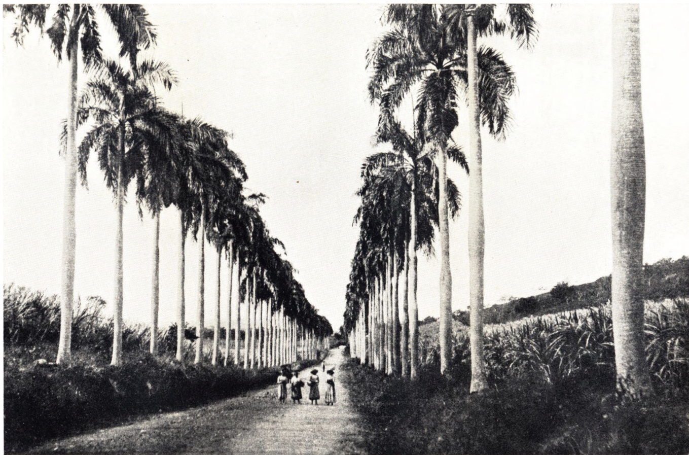
Kongepalmealleen paa Centerlinien i Nærheden af Christiansted. Litografi. Det kgl. Bibliotek.