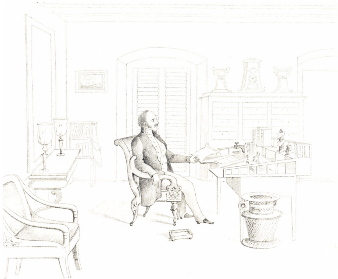
Generalguvernøren ved sit Skrivebord i Guvernementshuset. Efter en Tegning, antagelig af Fr. Scholten. Tilhører Forf. Man lægger Mærke til Glaskuplerne („shades“) omkring Lysene og til Persienerne, der holder Solen ude, men tillader Passatvinden at slippe igennem.