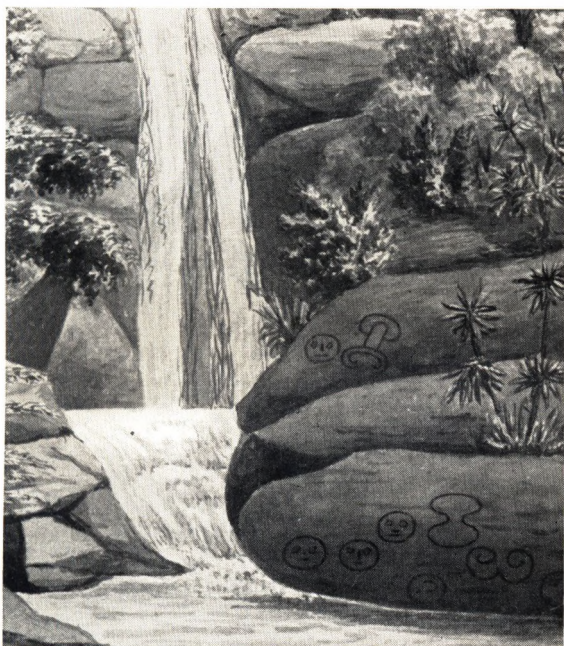
Mystiske Figurer indhuggede i en Klippe paa St. Jan, stam- mende fra Cariberne, Vestindiens Urindvaanere. Akvarel af Fr. v. Scholten.