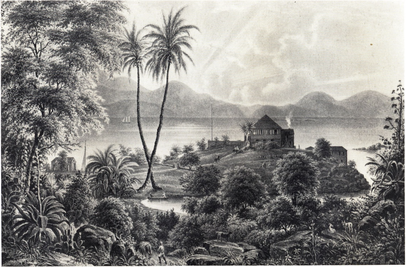
Cruzbay St. Jan. Litografi. Det kgl. Bibliotek. Efter Maleri af F. G. Melby. Maa altsaa være fra omkring Midten af forrige Aarh. Midtfor Landfogedboligen. I Baggrunden det ca. en halv Mil bortliggende. St. Thomas.