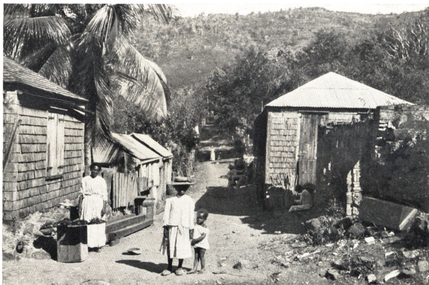
Fra Fattigkvarteret paa St. Thomas.