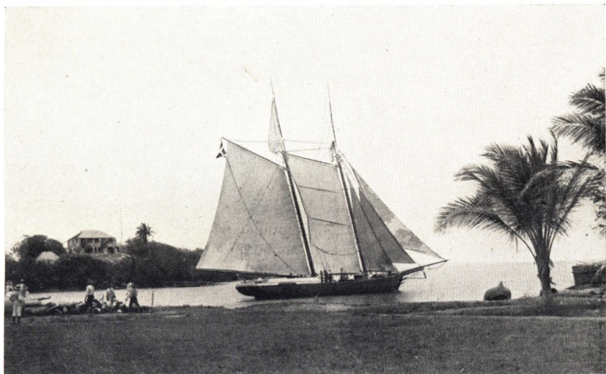
Gouvernementsskonnerten „Vigilant“, Post- og Passagerbefordring mellem St. Croix og St. Thomas, i Færd med at gaa ud af Christiansted Havn. Oprindelig Slavesmuglerskib. Holdt sit Hundredeaars Jubilæum i Slutningen af Halvfemserne i forrige Aarhundrede, men still going strong, og omfattet med Stolthed af sit farvede Mandskab.