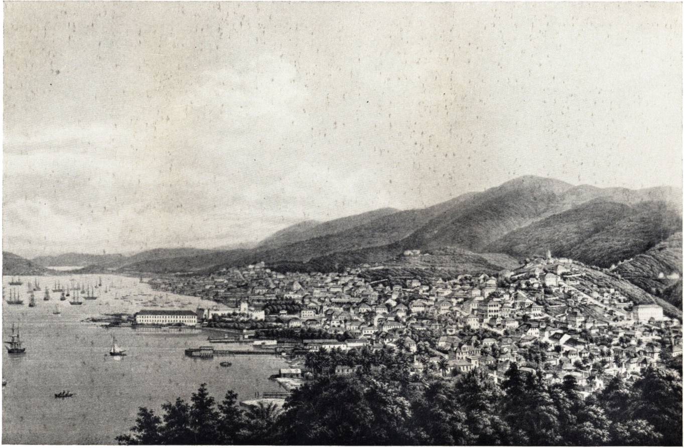
St. Thomas (officielt Charlotte Amalie). Byen malerisk beliggende paa de tre Høje, hvad der ikke fremtræder rigtig klart paa det i øvrigt gode Billede. Den højeste Top, St. Peter, (t. h.) er 1200' over Havet. Litografi 1858 efter Daguerrotypi.