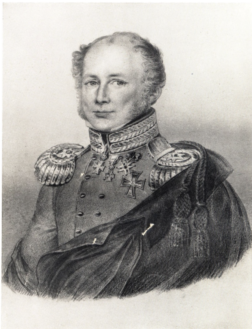
Efter en Kalltegning af Hoyer