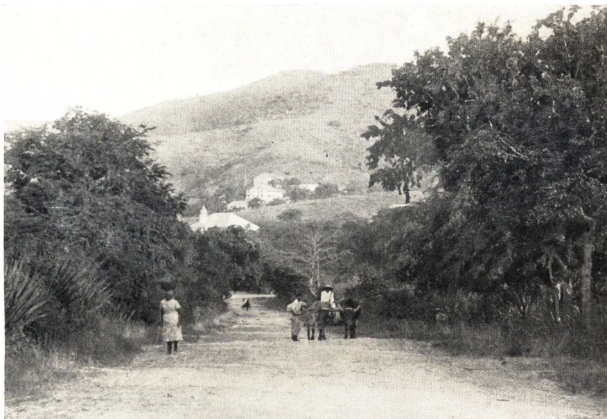
Indkørselen til Christiansted fra Nordsiden.