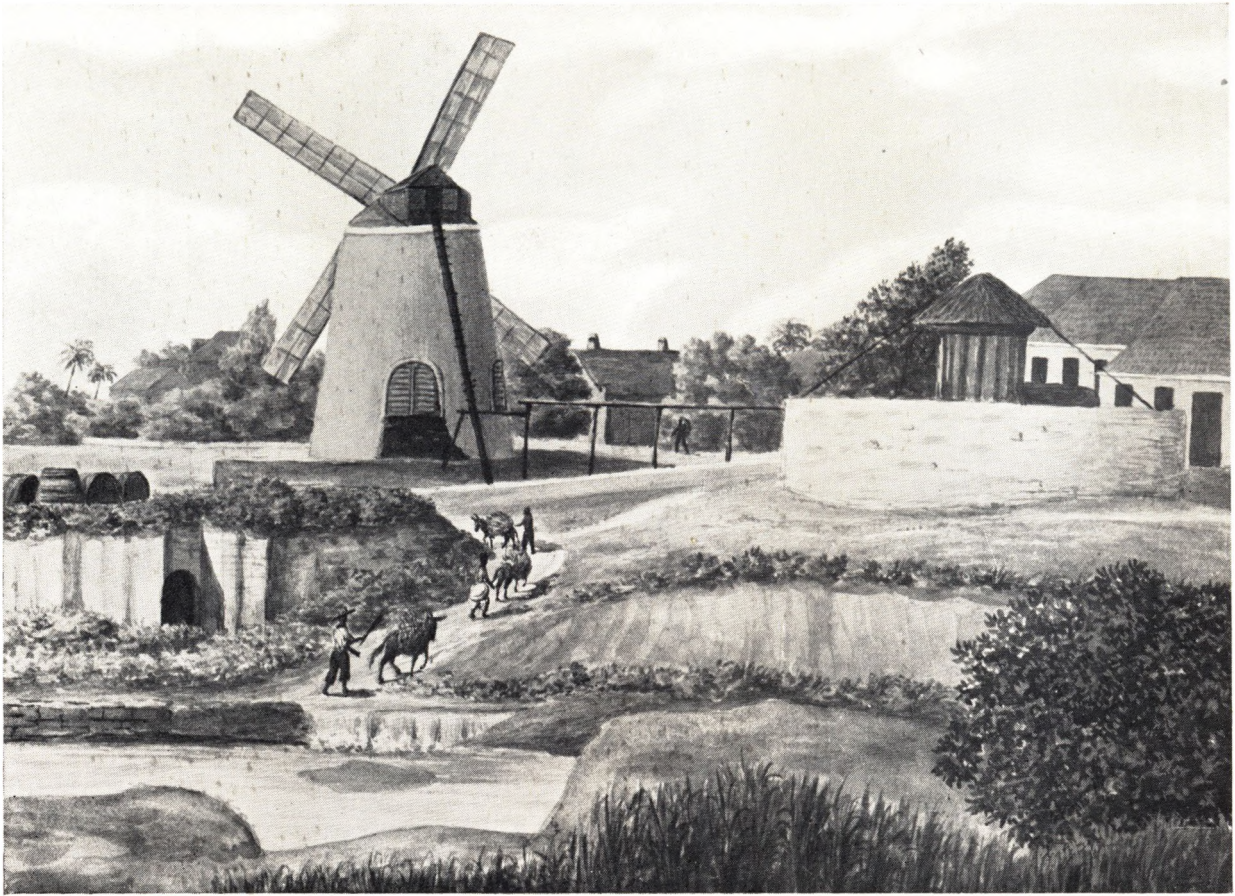
En Sukkermølle paa Plantagen Castle Coakley paa St. Croix. Akvarel af Fr. v. Scholten. Disse gamle Vindmøller er forlængst erstattede med dampdrevet Maskineri. Men saadan saa det altsaa ud for hundrede Aar siden, da Slaverne drev Æslerne belæssede med Sukkerrør op til Møllen, hvor Saften paa en primitiv Maade blev presset af Rørene.