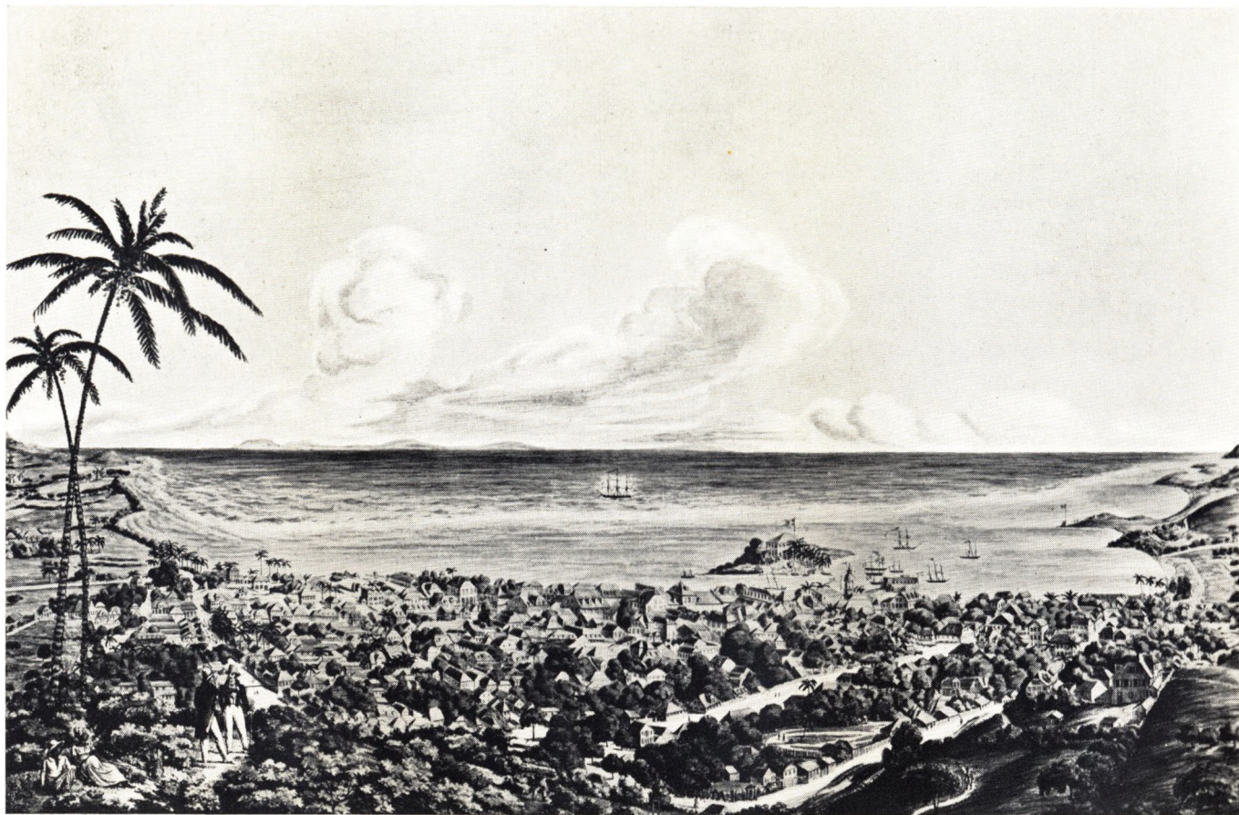
Byen Christiansted paa St. Croix. Tegning af N. P. Otte. Gengivet i Litografi. Flensborg 1831. Det kgl. Bibliotek. Af de to Gentlemens Paaklædning (t. v.) kan det nok ses, at Billedet ikke er af ny Dato. Iøvrigt er Korallrevet (den hvide Stribe i Vandet) ret fortegnet, idet man vanskelig deraf faar Indtryk af, at det ligger mindst en Fierdingvej ude. Øen i Baggrunden er det ti danske Mil Nord for liggende St. Thomas, hvis Toppe tydeligt kan ses.