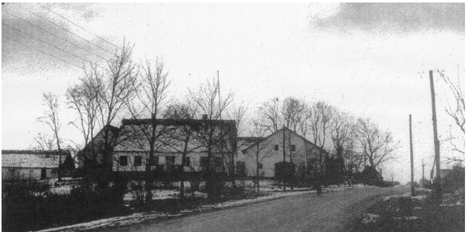
Udateret foto, nok 1940'erne, af Stendyssegård på Lyng Bygade

Hun havde altid været et arbejdsmandsmand og næsten aldrig syg. Hun havde 6 børn, 2 sønner og 4 døtre.