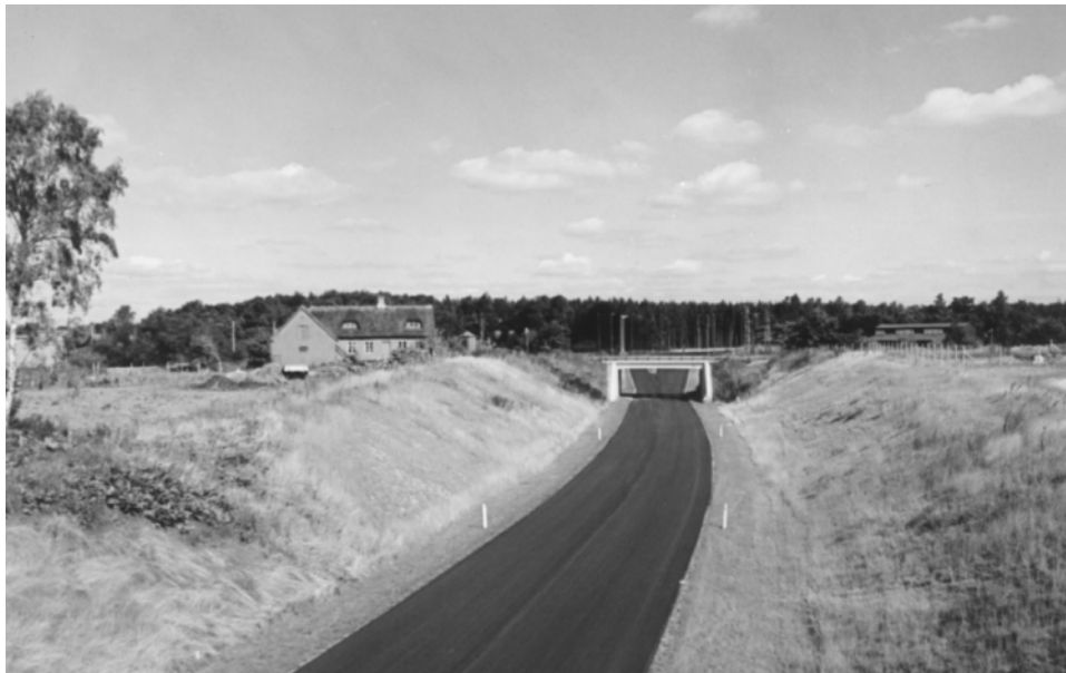
Nymøllevej med Møggården tv., jernbanebroen og Tokkekøb Hegn i baggrunden. 1982