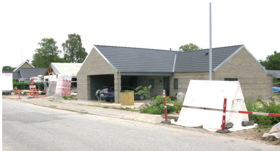
De fire nye huse på Lindeallé 18-24 kom til at ligge meget tæt. 2011