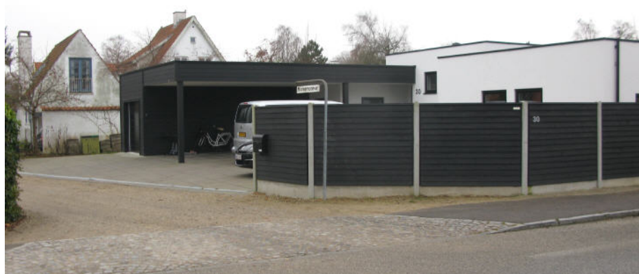
Tokkekøbvej 30 - før og nu, 2009 og 2013

bliver mere og mere præget af de dominerende typehusfirmaers ret ens huse.