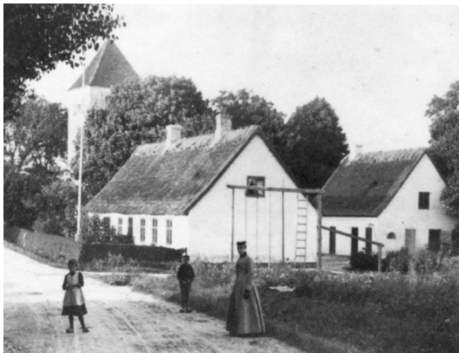
Lyngby Skole med de udendørs gymnastikredskaber, ca. 1890

skrivning efter forskrift. Kun i det sidste skoleår lidt skrivning efter diktat.