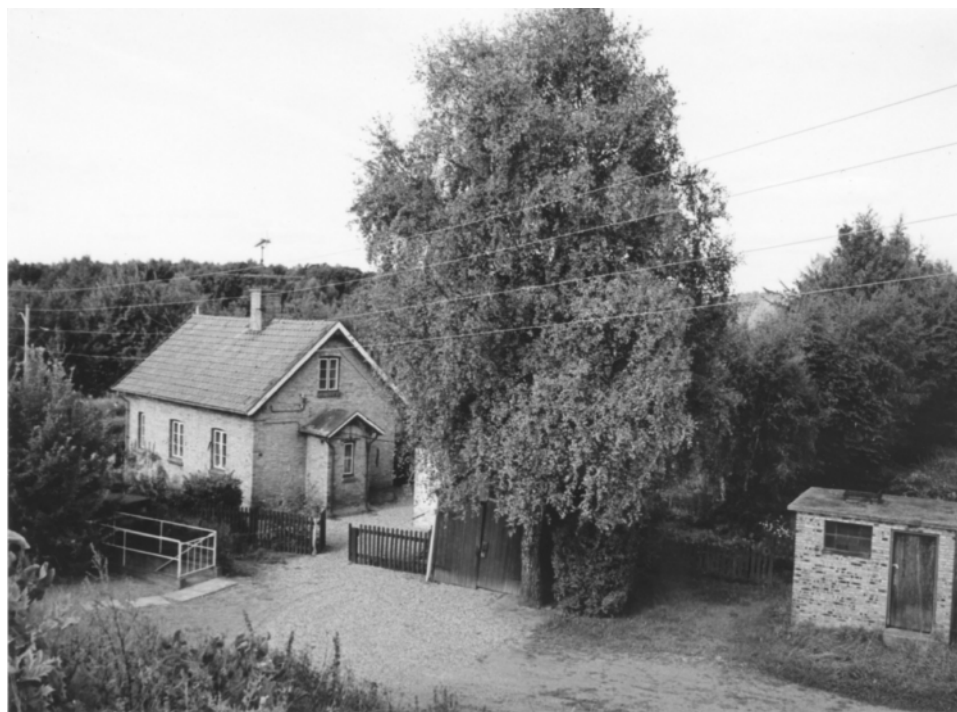
Det nu nedrevne banehus ved Hesselgårdsvej tv. med Høvelte Vandværks pumpehus th og nedgangen til vandværket bag den hvide låge.1982