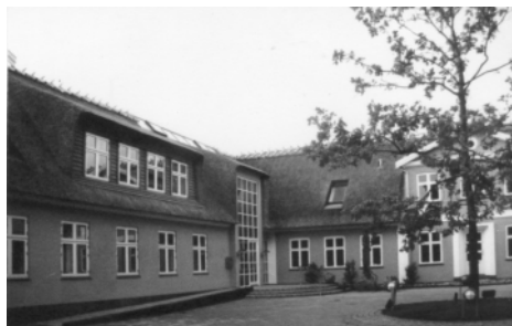
Rosmosegård i Blovstrød før og nu.