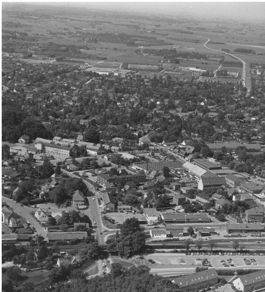
Luftfoto af Lillerød med Banevang og jernbanen i forgrunden og Amsvej, der går under viadukten og ind i billedet mod Biblioteket. Til venstre Pr. Valdemars Allé og th. MD Madsensvej. Kollerødvej snor sig øverst th. Midt '80-erne