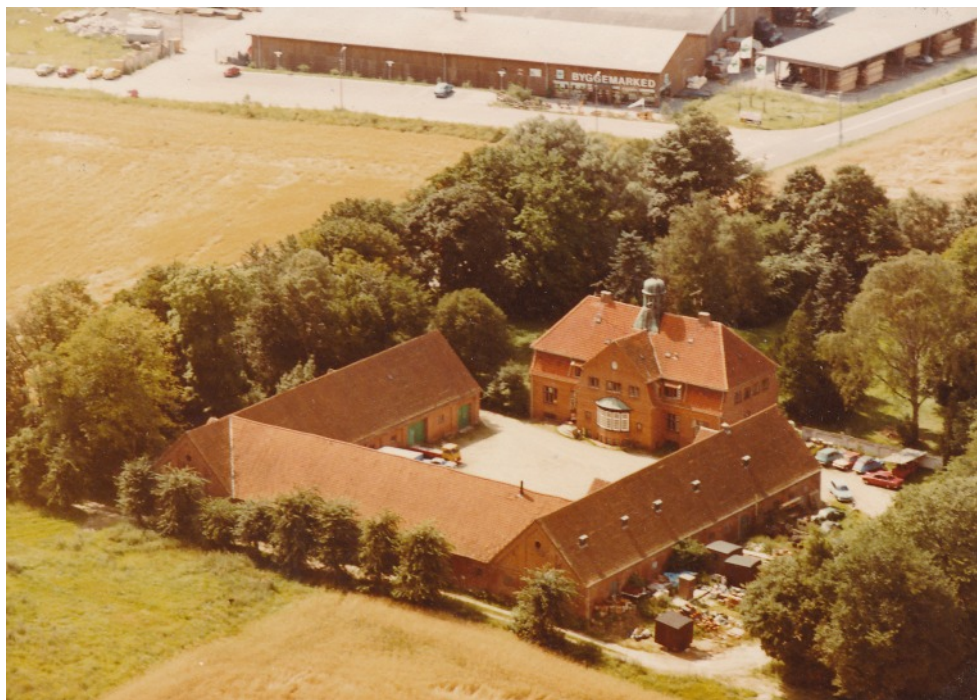
Ny Allerødgaard i 1980, efter Allerød Kommunes overtagelse og nogen ombygning. Men længe før Sjælsø-gruppens totalombygning og gårdspladsens overdækning 2001-03.