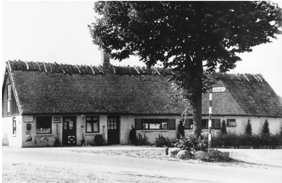
Lyngby Købmandshandel var indrettet i det stråttækte hus på Lyngby Bygade 31, der hvor vejen går til Lillerød.