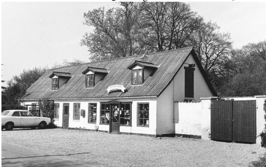
'Købmandsgaarden' på Kollerød Bygade 2 i 1980.