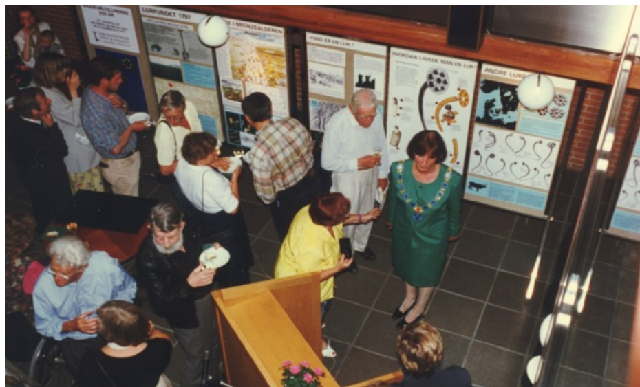
200-året for fundet af Brudevælte-lurerne blev fejret med lurtrut, LAFAKs udstilling og overrækkelse af Allerøds borgmesterkæde i det gamle rådhus. 1997

forsøgt at få Nationalmuseet til at lave en udstilling om lurerne og postvæsnen til at lave et frimærke, men ingen viste interesse for sagen. Så besluttede vi selv at fejre begivenheden med en udstilling, og i samarbejde med Allerød Kommune blev den 2. juni 1997 til noget af en folkefest.