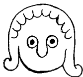
Fig. 1. Westwood, Facsimiles S. 84. (10. Aarh.) Irsk (Pergament).

Dette Mandshoved har efter Dr. Lis Jacobsen (Scandia IV, 2, S. 247 og Eggum-Stenen S. 41, Fodnote) sikkert apotropaisk Betydning (∴ afværgende, skræmmende), ligesom Dra-Vikingskibene, Lov skulde nedne nærmede sig Is-skulde skræmme ter bort. — Det Mandshoved paa de aabenbart vilde forstyrre