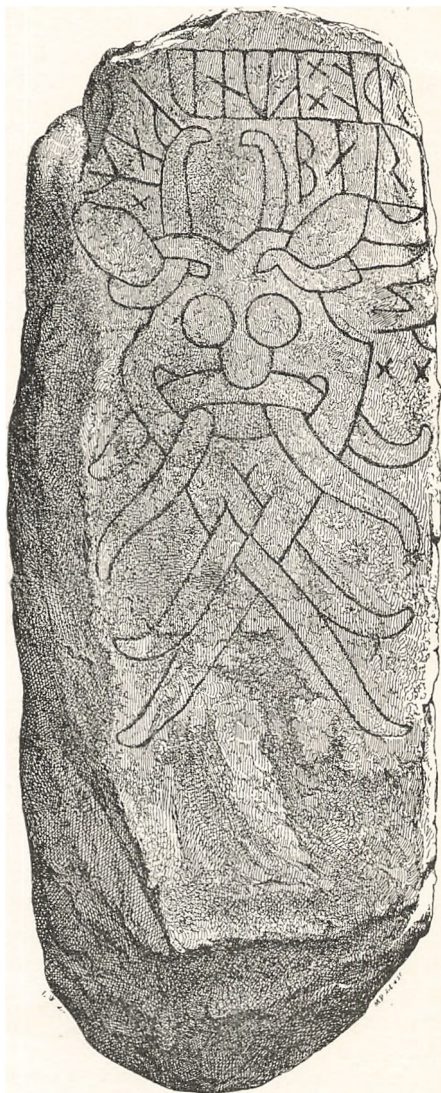
Aarhus-Stenen II (Wimmer).

Fra oven mod venstre læses { þā x kunukaR Bar- { da Konger stre-