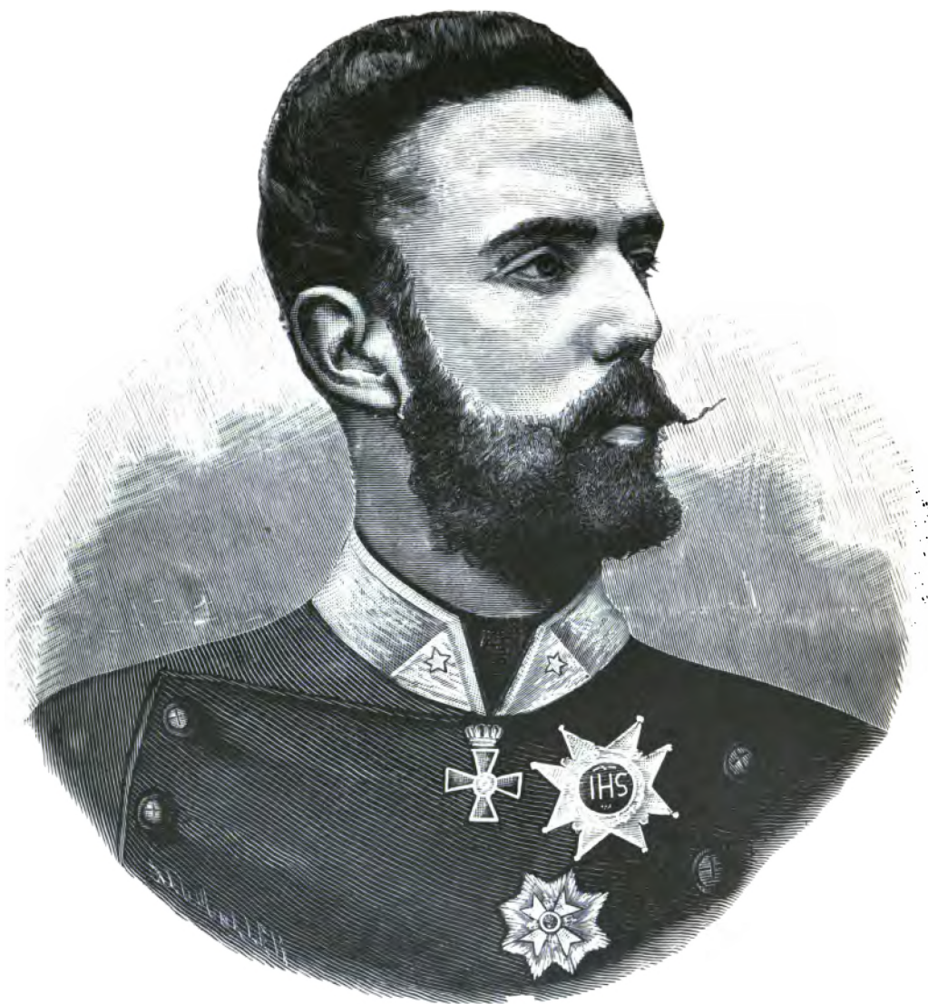
HANS KONGELIGE HØIHED KRONPRINS OSCAR GUSTAF ADOLPH, GENERALMAJOR I DEN NORSKE ARMÉ.