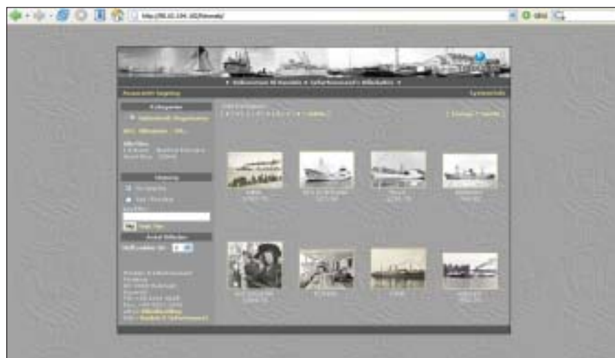
Søgesiden for Det digitale fotoarkiv.