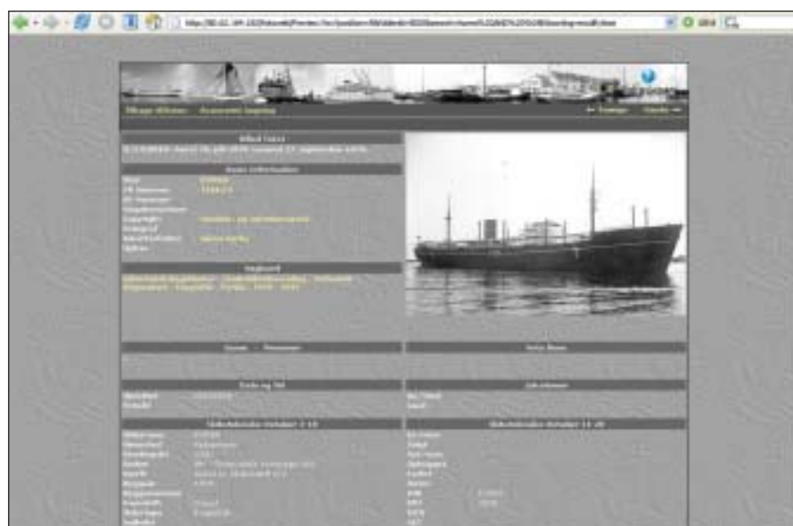
ØKs motorskib Korea, bygget 1939