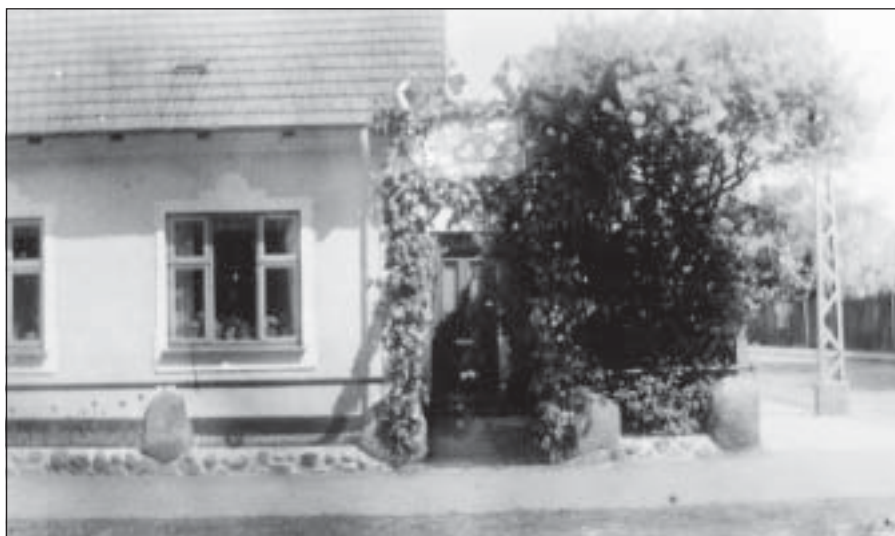
Min mormors hus i Maribo, det nærmeste jeg kommer et barndomshjem. Her tilbragte jeg mine første barndomsår.

Men et eller andet sted rørte hendes stolthed over sin familie alligevel noget i mig. Jeg ønskede af hele mit hjerte at kunne have den samme gnist i øjnene, den samme begejstring og den samme stolthed over min egen familie, som min veninde havde over sin. Langsomt begyndte interessen for min egen slægt og dens historie at spire, og før jeg vidste af det, sad også jeg med næsen begravet i de gamle protokoller på arkiverne.