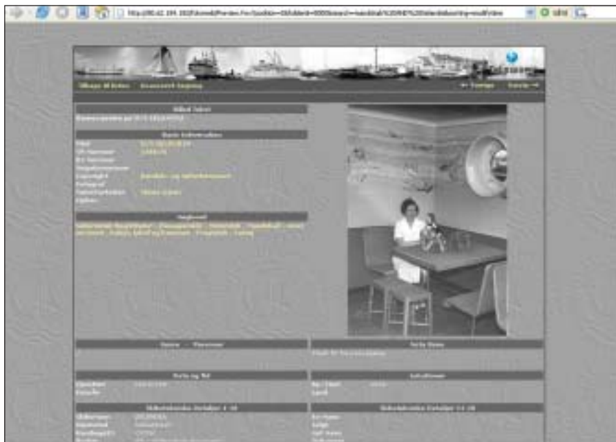
Børneværelse på Selandia