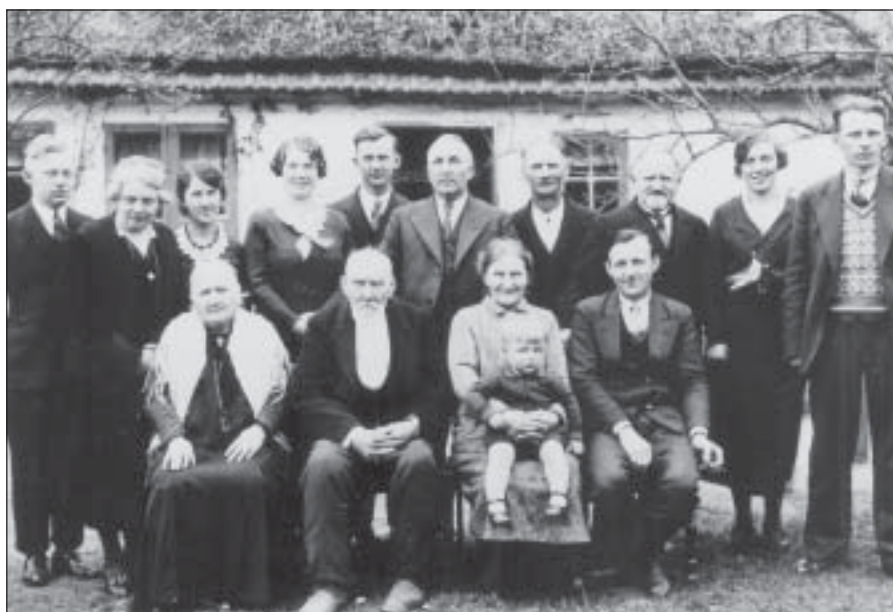
Smedefamilien - 4 generationer i lige linje - og min far var udlært smed, som den eneste af sin 3 brødre.

Det virkelig interessante var alt det, der stod imellem linjerne. I journalen kunne jeg læse, at min far var blevet presset til at tage arbejde som almin-