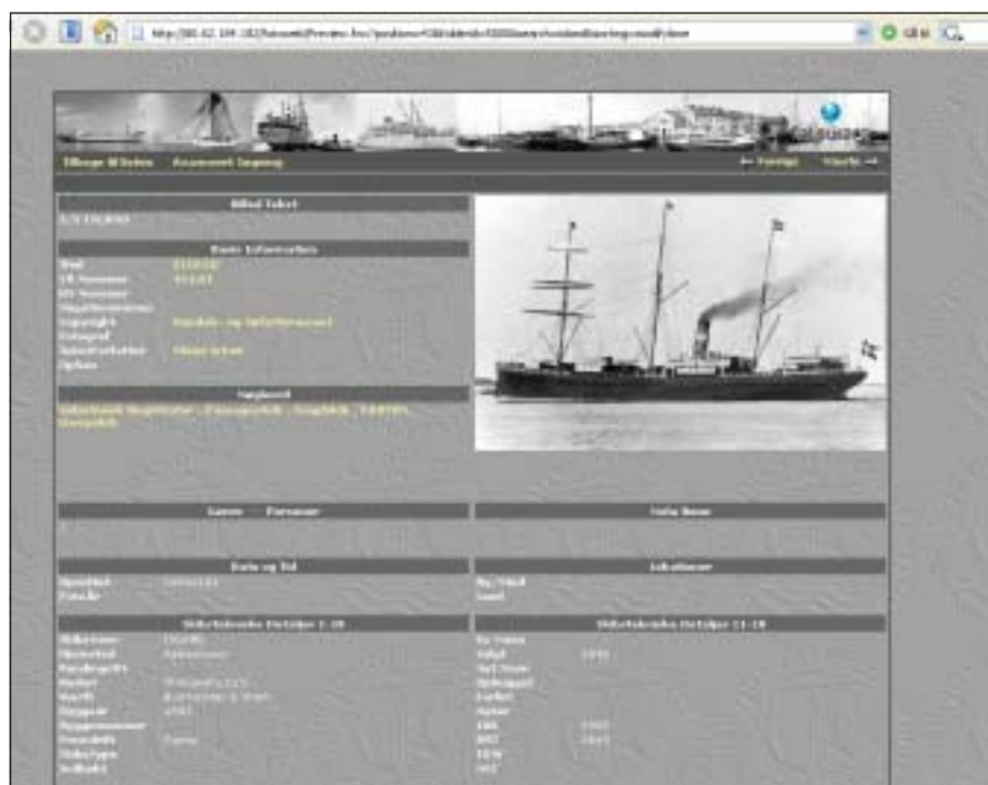
Gengivelse fra Handels og Søfartsmuseets digitale fotosamling af Thingvalla liniens dampskib „Island“, som Valborg sejlede til Amerika med.