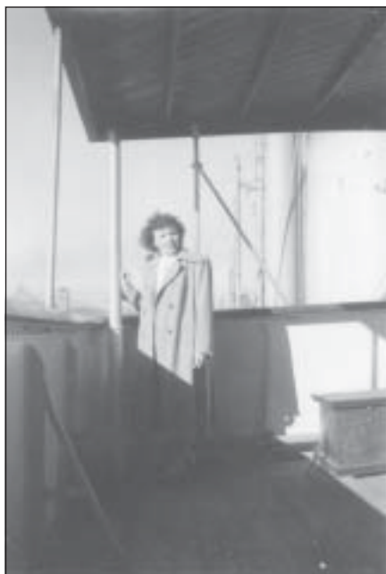
Dortes mor på dækket af Korea