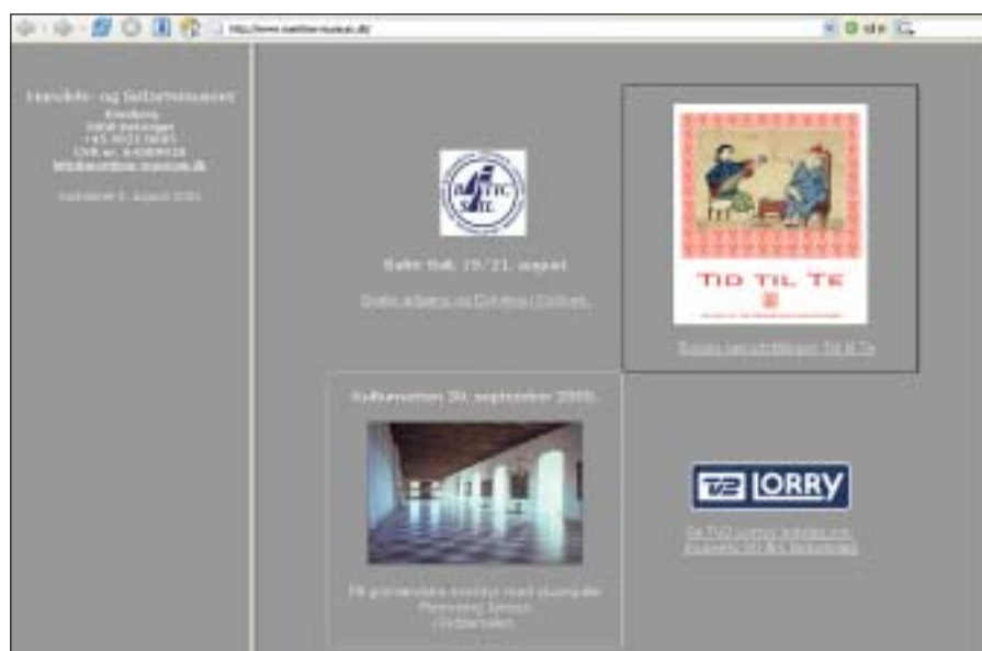
Indgangssiden til Museets hjemmeside

Der var straks bid. I sandhed et meget specielt øjeblik, da vi for før-