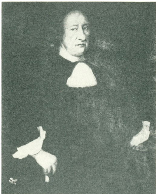
FRIEDRICH VON LOWTZOW 1644–1706 TIL RENSOW, VIETSCHOW OG BELITZ (nr. 13)