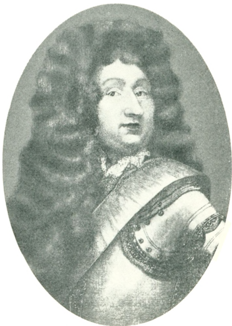
MAJOR CHRISTOF FRIEDRICH VON LOWZOW 1670–1716 (nr. 18)