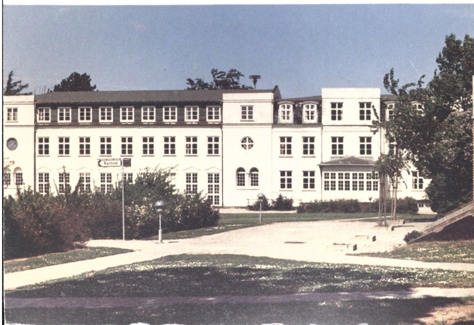
Festsal og undervisnings- lokaler