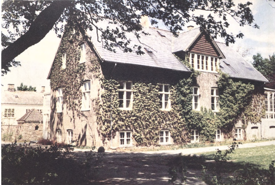
Her startede skolen