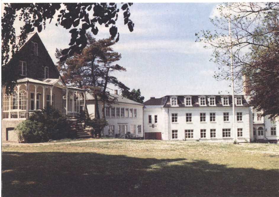
Elevbygning og spisesal