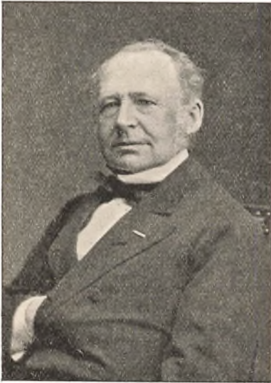
Gehejmekonferentsraad J. P. Trap.