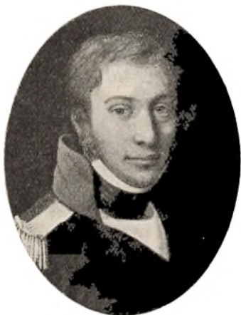
F. L. d'Auchamp, 1776–1847.

François Louis d'Auchamp 1) , født 31. Dec. 1776, kom 1798 til Danmark, anbefalet af Grev Løvendal, der havde kendt ham