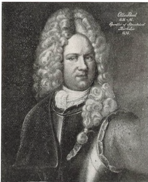
OTTO SKEEL. 1636—96.

Det er kun meget lidt, der er tilbage af den gamle Hovedbygning, som brændte 1818; baade de to Sidefløje og en For-