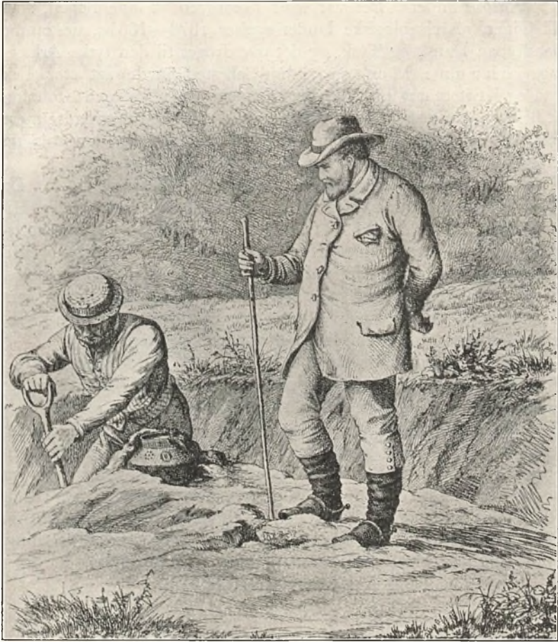
Urneudgravning (Til højre Sehested). Kobberstik af Magnus Petersen 1882.