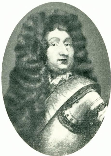
MAJOR CHRISTOF FRIEDRICH VON LOWZOW 1670–1716 (nr. 18)