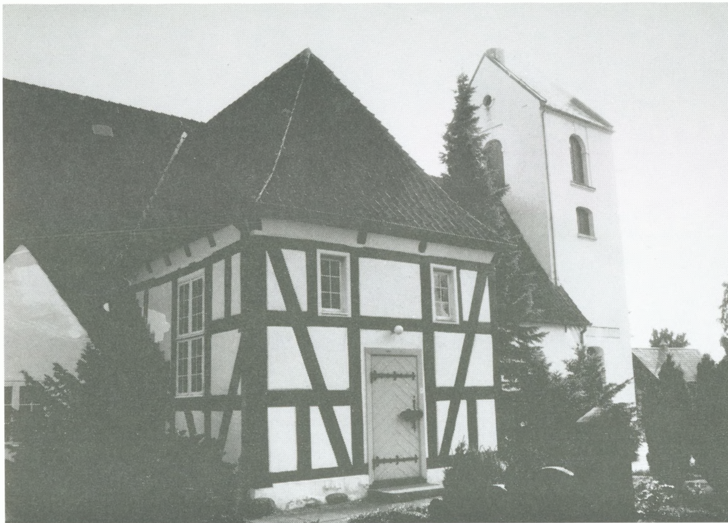
Hvidovre Kirke fra nord. Valbyskibet blev opført i 2. halvdel af 1600-tallet for at give plads for Valbybønderne, der før havde brugt Vor Frue Kirke i København.