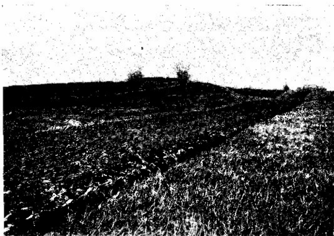
Ullerup Kirkebakke set fra Sydøst.