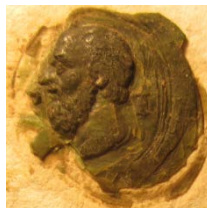
Peder Judes segl 1556